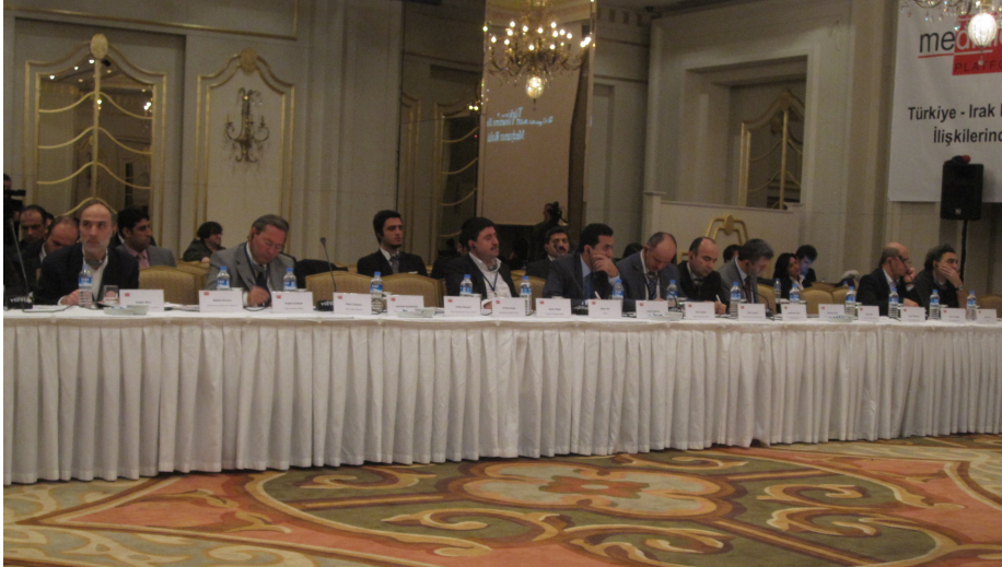
هسستنبول: دپالوگى كورد و تورك