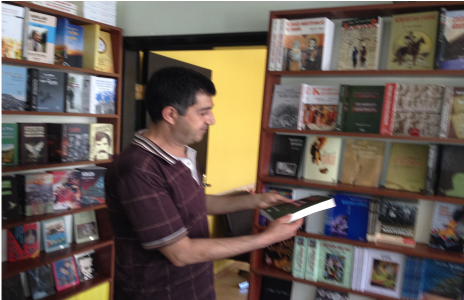
کتابخانهی چوارچرا له ننگاره