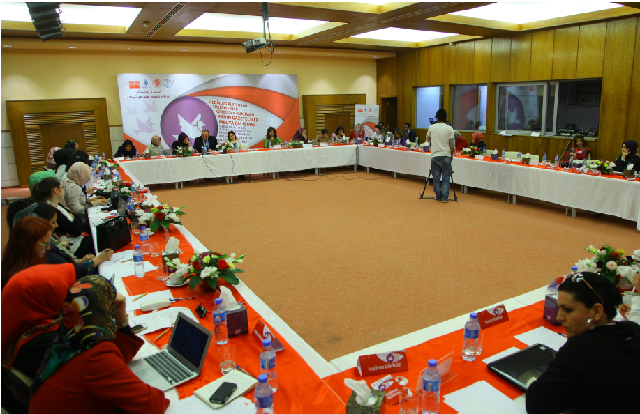
كونفرانسی میدیاکارانی میهنی کورد و تورک