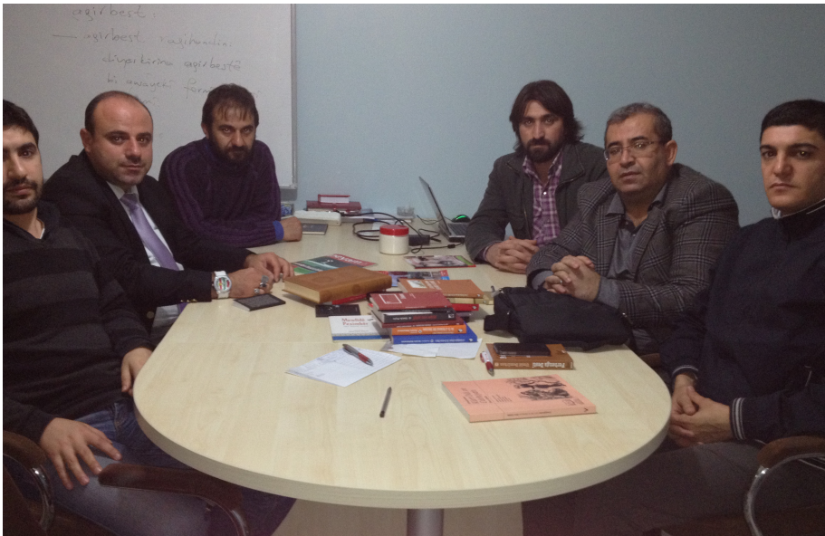
هستمنبرول: لهگل رووناکپیرانی نکتوی پرومو قیسلامخوازدا