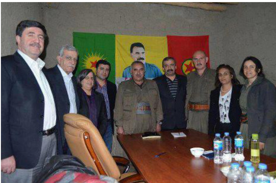
وەفدی بەدوێپە نامەی ئۆجەلاتیان گەیاندە قەندیل