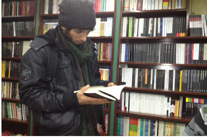
سادات : هونرمندی لاور