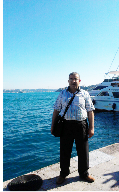
تاستهبول: تامادهیی رۇژنامانوس بۇ گهت