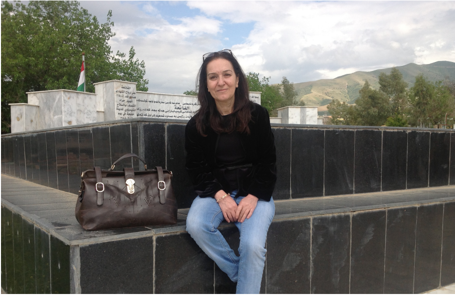
بيلما جكورنا خاوضى كتيبي فيلمى كوردپيهكى دهولت لاسر مزارى شهيدانى هلبهجه