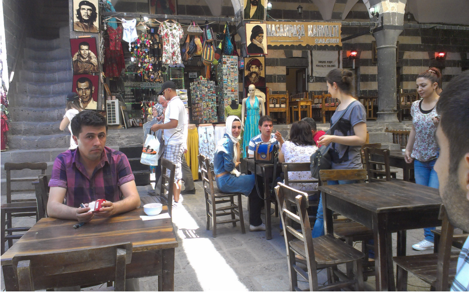
بازاری (خاصه پاشاخانه) لهدیارپهکر