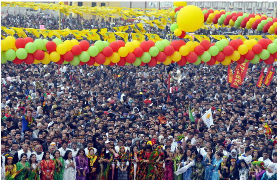
میتنگیکی فراوانی کوردان