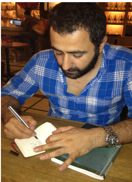
ولات فای خویندکاری دکتورا