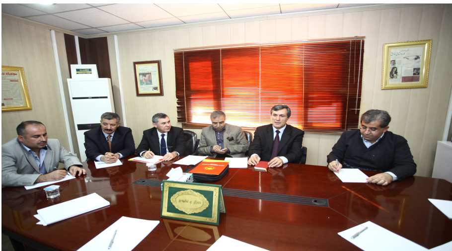
لەگەڵ وهفدی پارتی هەک پار بەسەرۆکایەتی بەیڕەم گۆزەل