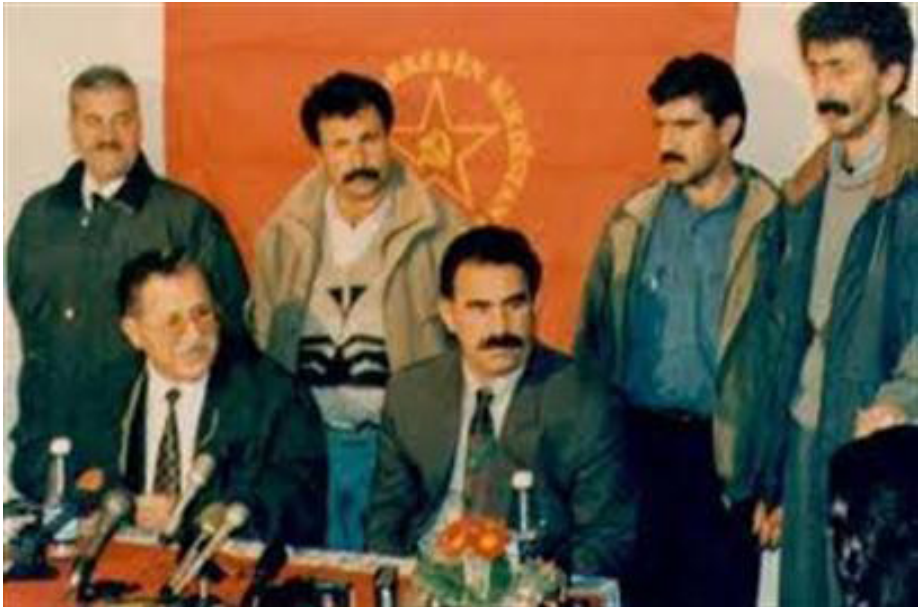
یەکەم: کۆنفرانسی ئۆجەلان بۆ ئاگرێب، بەهاری ١٩٩٣