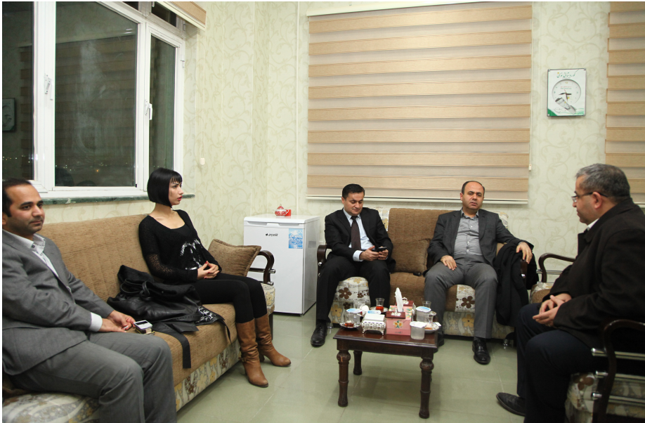
بازمبیری تارمناشەش میوانی کوردستان بوو