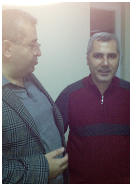
له گیل سامی تان سهروکی فیستای هنستیوی کورد له هاستنپول