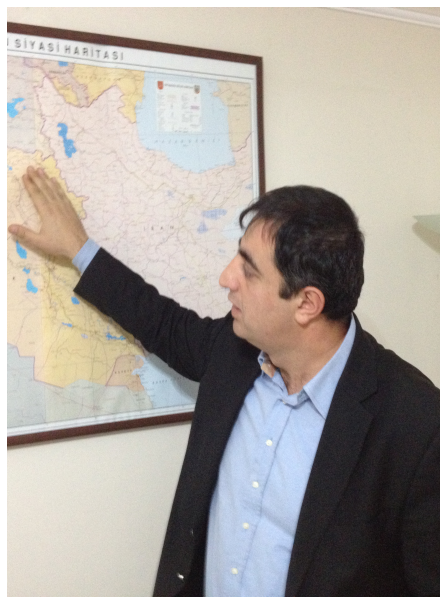
فهیسنل تاپهان : پهمانکاری روژهلاتی ناومراست