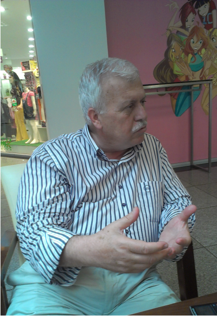
کولرجه وتیپیژی فتهوللا گویلن