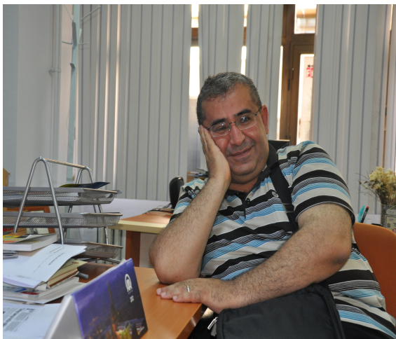
لنوسینگى تەلەفزیونی گەلی کوردستان له دیاربەکر