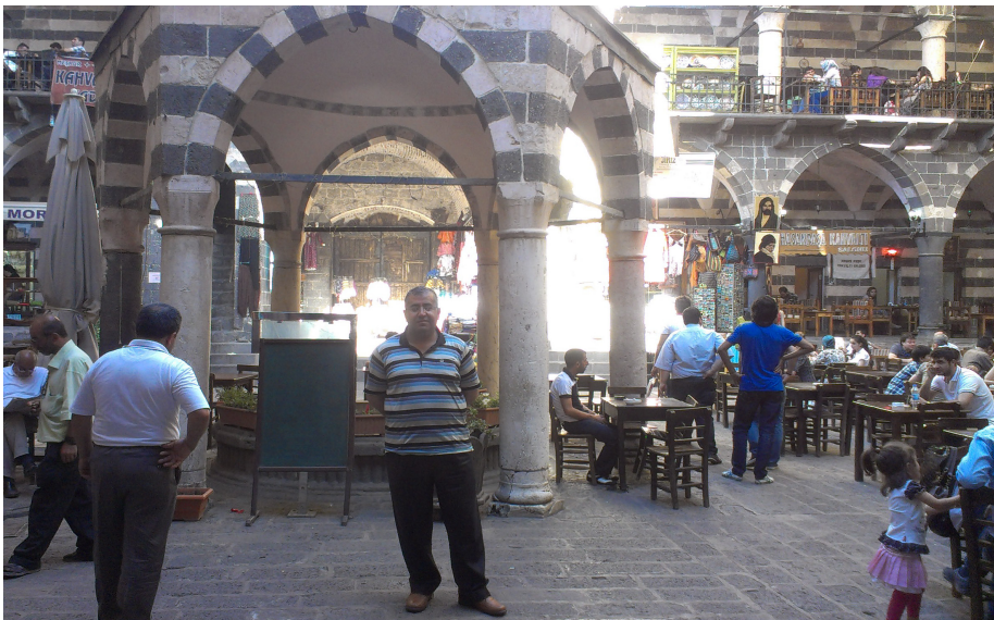
دیاربکر، لنگاو بازاری حاسه پاشاخانه