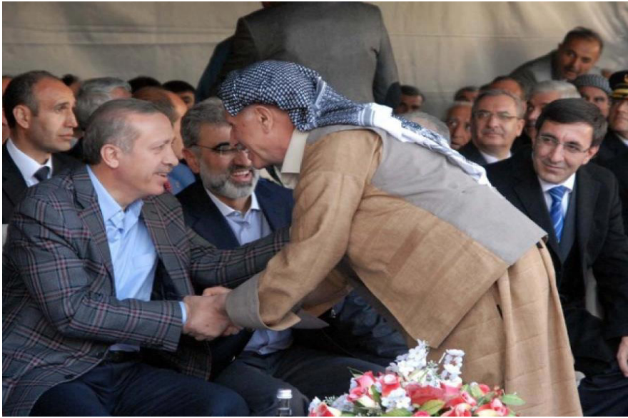
ئەردۆگان ، ھەنگاوی نزیكایەتی لە كوردە