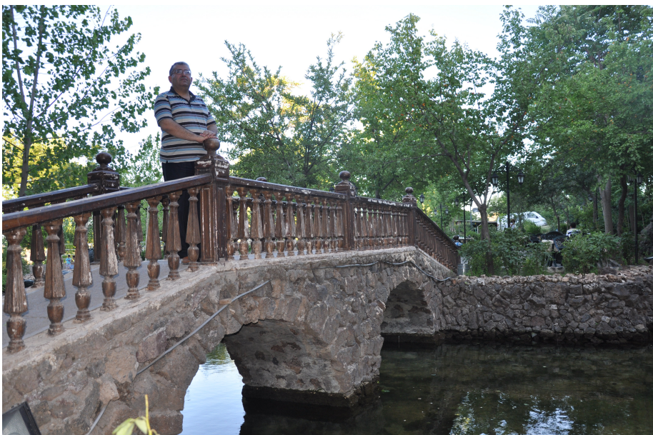
دیاربەکر: غازى کره‌ک