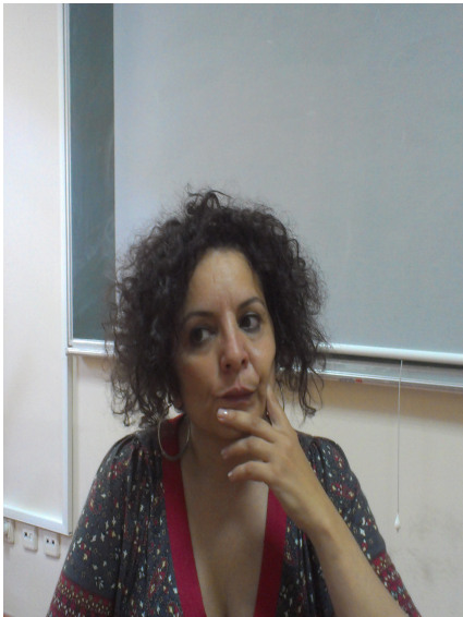
پروفیسور نازان کوستونداک