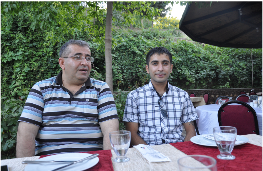
له گیل کاک سهرجه له رۆستورانیکدا