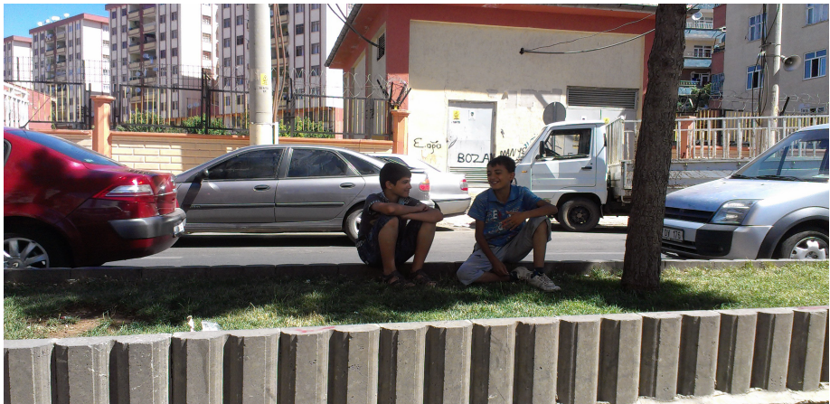
مىدالانى قېشكىر لە دياربەك