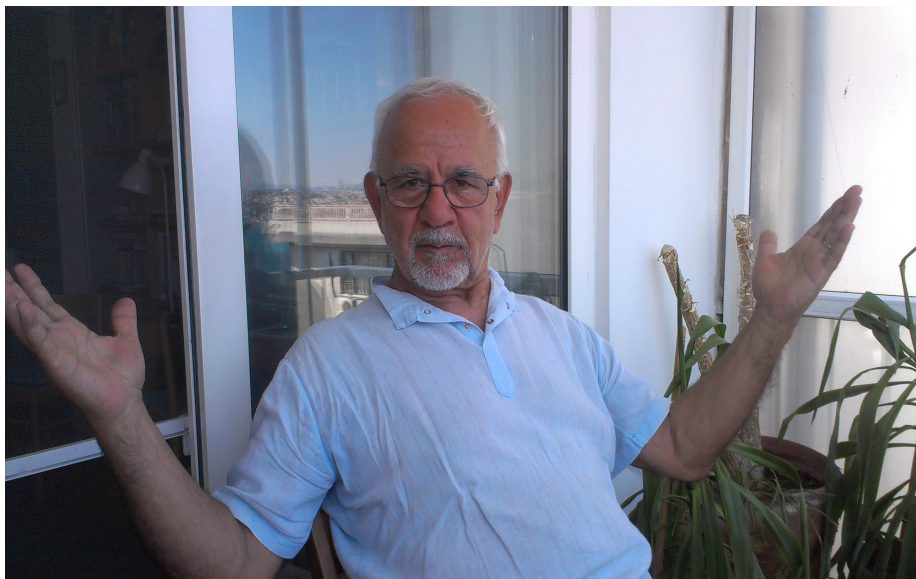
گنجای کورسوی دهورانی چایی تورک پاس دهکات