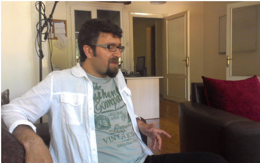
کاک فرهاد گفتوگوکاریکی خوبشیرین ، که هاوکاری زوری کردوم