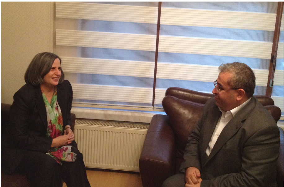
لکمل گولتان کشناک - منقره