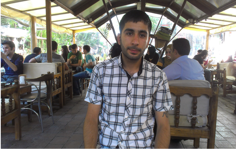
دیاربه‌کر: کاک سرحد، هاوکاری گهفته‌کای دیاربه‌کریم بوو