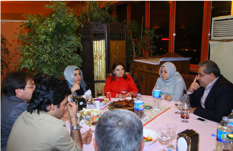
وهدی میدیاکارانی مینهی تورک