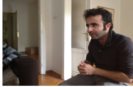
هوبهدوللا هاكان ، لاورى كوردى هسستنبول