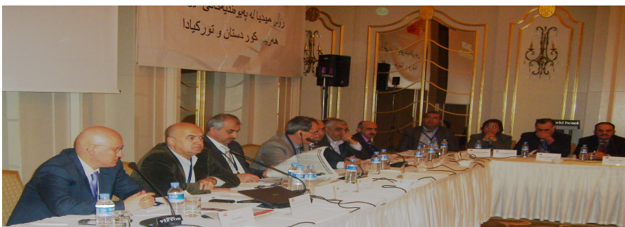
دیالۆگ لەسەر هاوبەشەکانی کورد و تورک