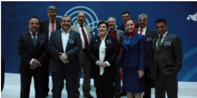
وەفدی عێراق و كوردستان لە كۆنفرانسی تاشتی ھین لە ئاستمبول