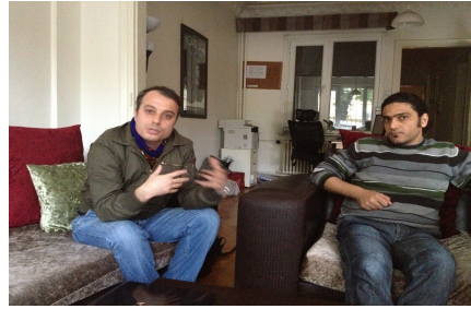
كاك حليم ، روزنامهوان سالج كقديپ