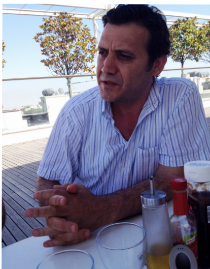
رمسلان بایزن: خهم و خهونی سهرمایه گوزاری کوردی