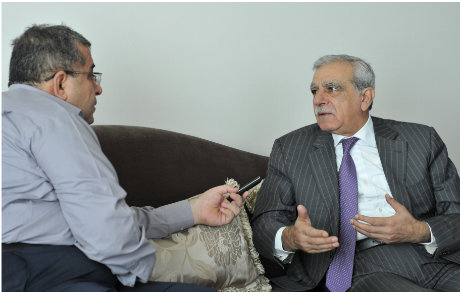
محمد تورک: ديموکراسی له پيری هر دوگاندا نيپه