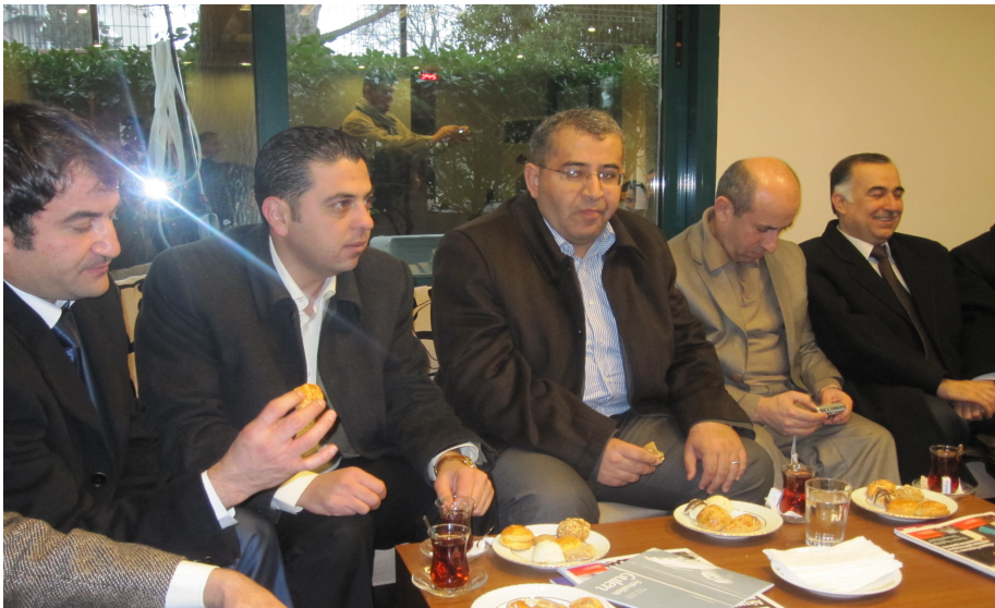
سەردانى ۋەقنى نووسەرانى تورىك لە ئاستانبول