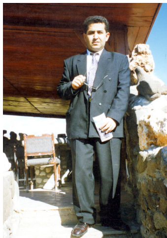
په‌کەم سەردانم بۆ دیاربەکر له‌ سالی ١٩٩٩دا