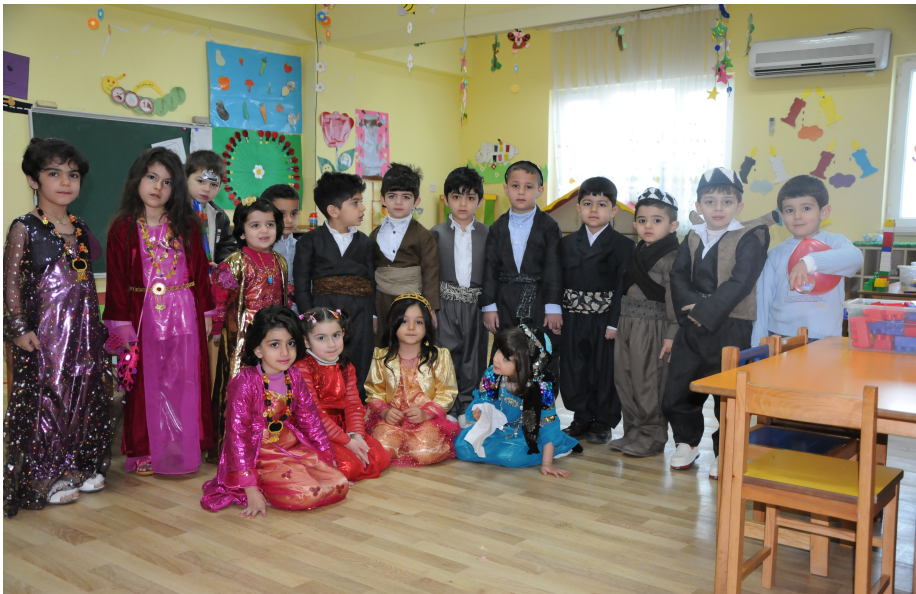
باخچهی مندالانی (ساوایانی سلیمانی) سر به کومپانیای فزاله ر پرژیهکی گوپلهیپهکان) له ههریمی کوردستان