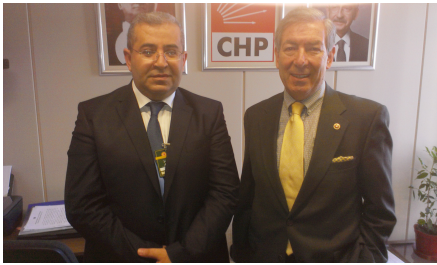
لەكەل نۆپىسى حزبەكى ئاتتورك