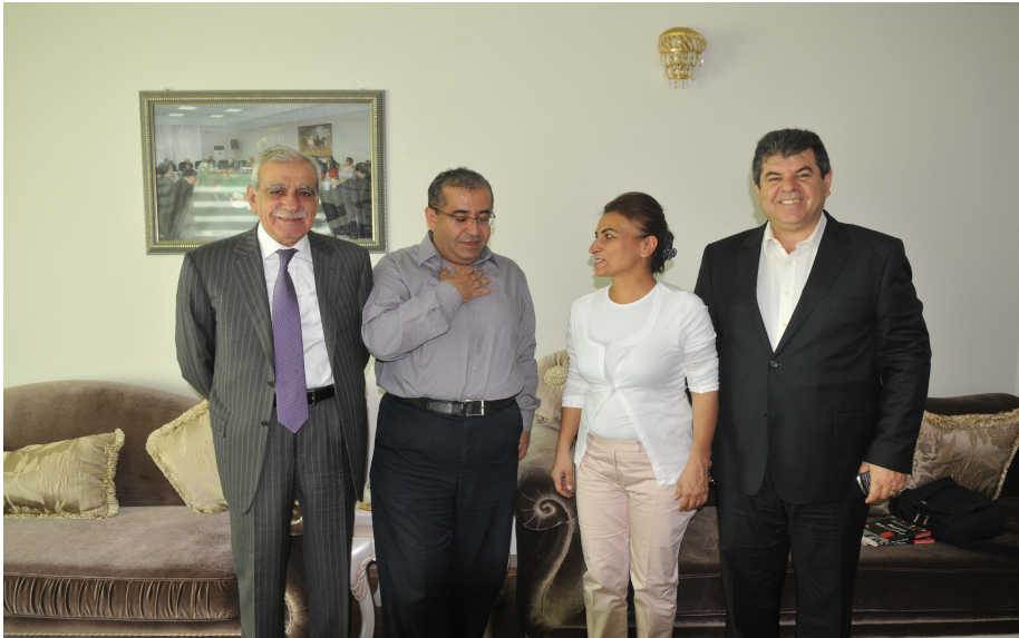
گللالی ، ناپسالی توغلوک ، لهحمده تورک ، نووسلر