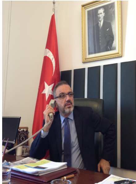
سپی ساکیک ، پرلمانی تورکیا