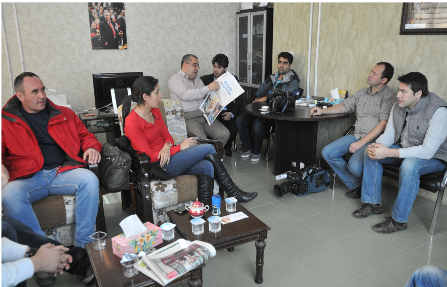
روژنامانوسانی تورک دوای سردانی قاندهیل ، میوانی بئنده برون