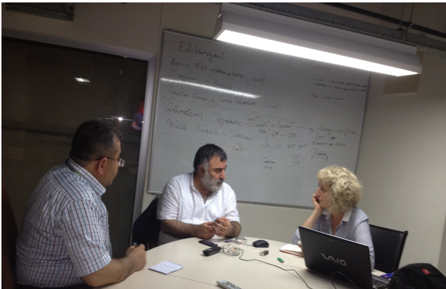
له کابل دهغهځان و له یووب پوړج