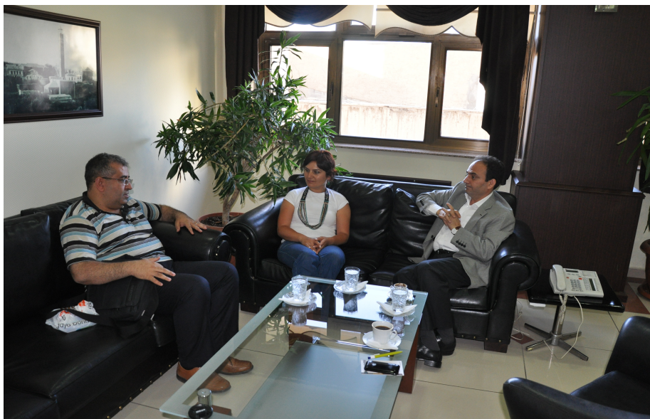
له سردانی عوسمان بایدهمیر سرۆکی شارهوانی گهره دیاربهکر