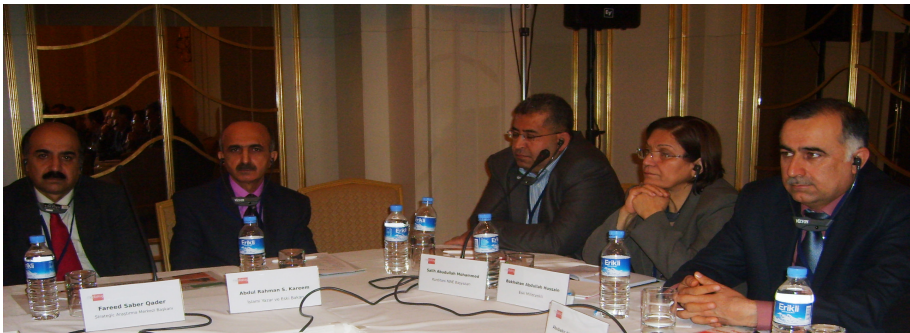
لەگەڵ وهفدی کوردستان له دیالۆگی میدیاکارانی کورد و تورک