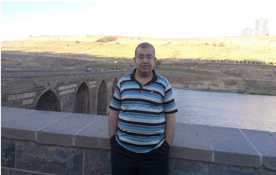
دیاربه‌کر: سووریک کیپ‌کئی سووری چین ده‌کات