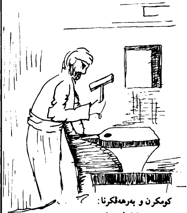
كومكرون و بهره فكرنا: كارل هايترز و گيرت هونگر