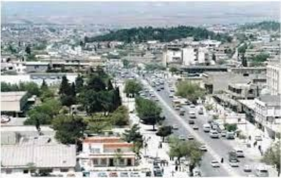
Slurmāni - گۆرئەندەگانی باشووری - South Kurdistan