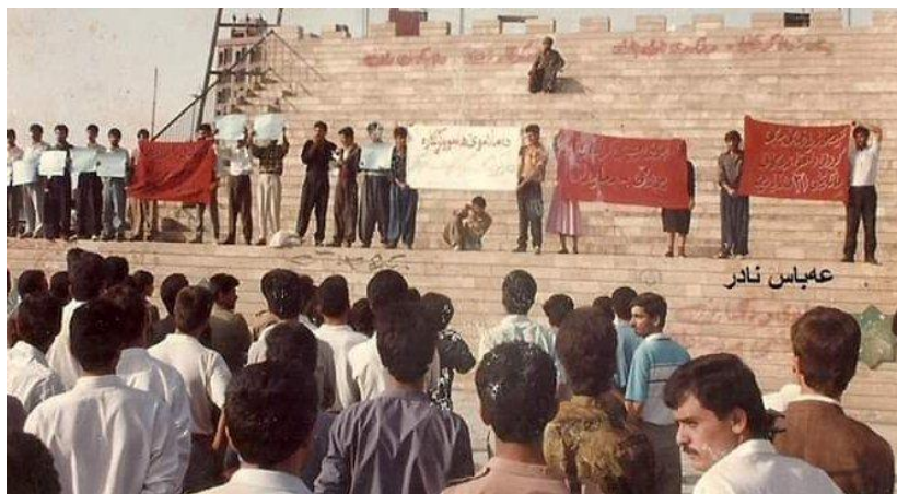
خۆپیشاندان بۆمافی کریکاران بەبۆنەی ۱ی ئایار موه