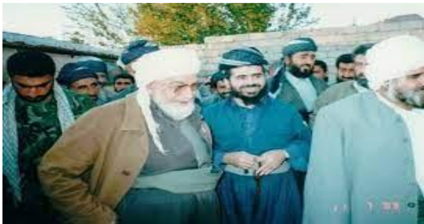
رابعرانی بزوتنهوی ئیسلامی