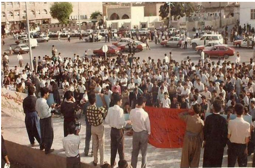
خویشاندانی کریکارانی دهواجن ۱۹۹۲