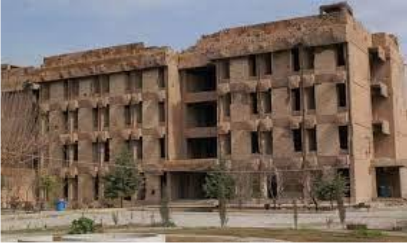
نہمنہ سوور مکہ سیمبولی تاوانکاری بہ عس