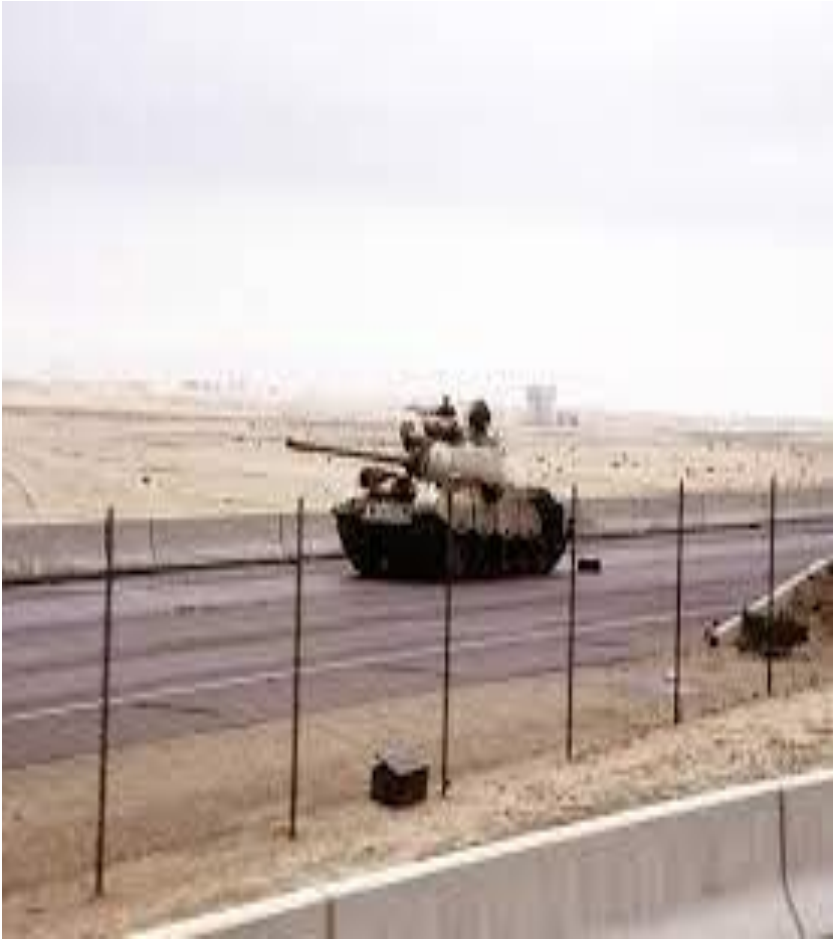
داگیرکردنی کوهیت له ۱۹۹۰