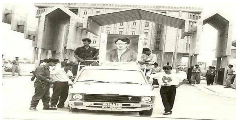
خۆپیشاندان دژی تیرۆرکردنی رهئوف ئاکرهیی لهسالی ۱۹۹۳