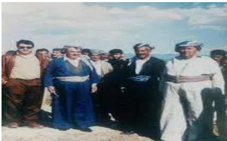
حسین ناغاو بهشیک لهسه کرده کانی سورچی