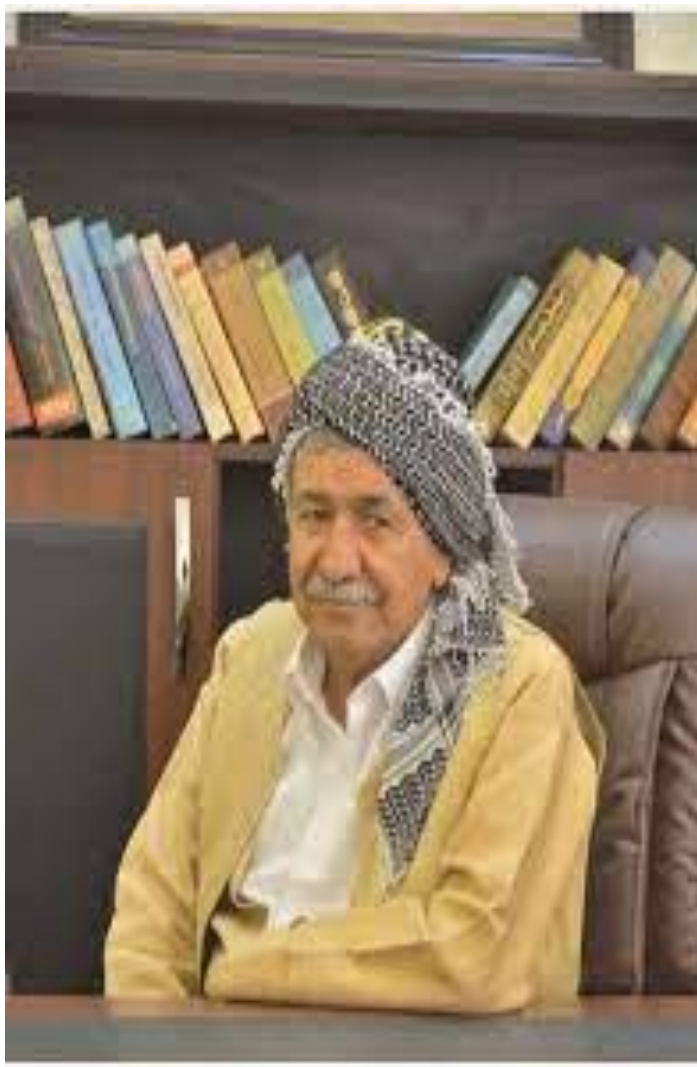
مامند قه شقه