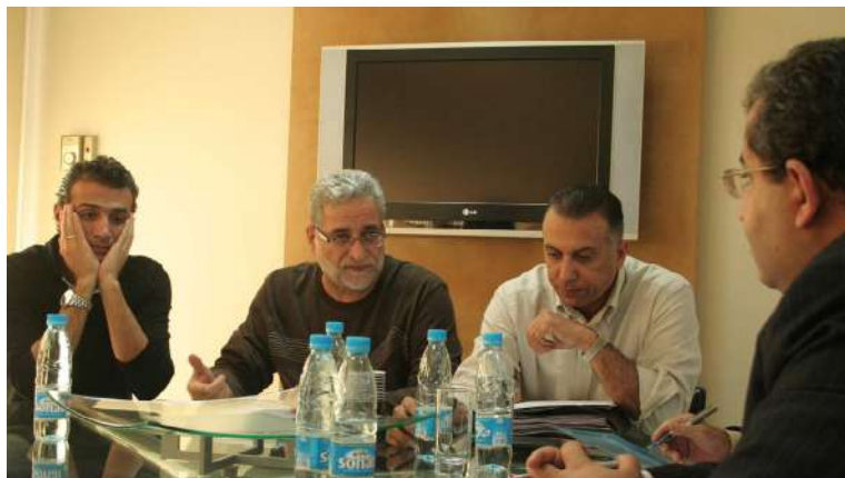
لوبنان: گفتوگو له سه ر پرۆزه ی الاسبوعية