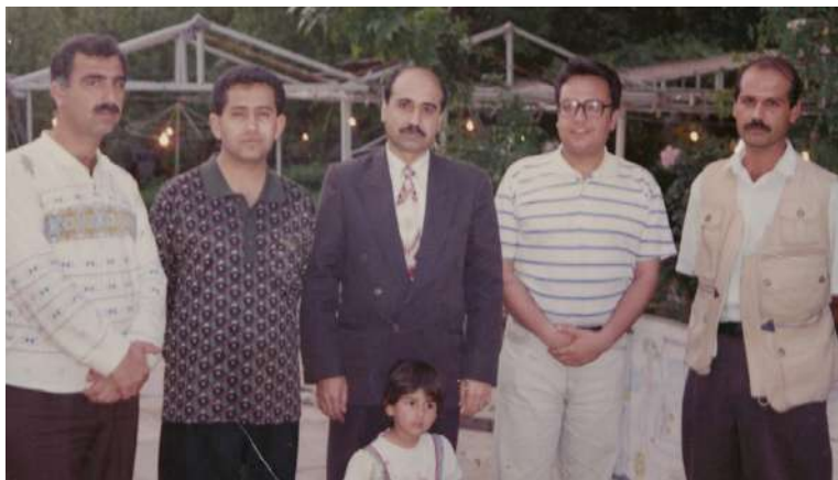
هاورپییانی پروژهی گوڤاری تایم