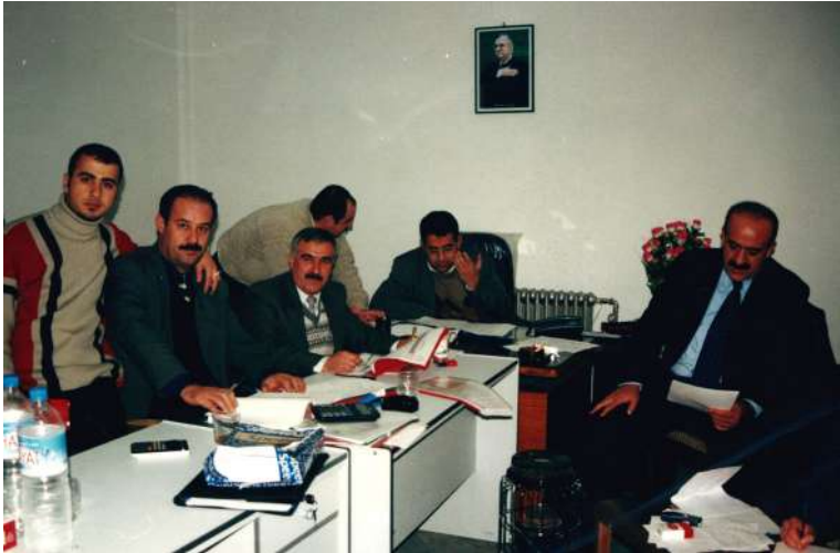
سلیمانی: سه‌رۆکایه‌تی ئەنجومه‌نی وه‌زیرانه‌ به‌شی راگه‌یاندن و په‌یوه‌ندییه‌ گشتیه‌کان کارکردن له‌سه‌ر کارنامه‌ی حکومه‌تی هه‌رێم