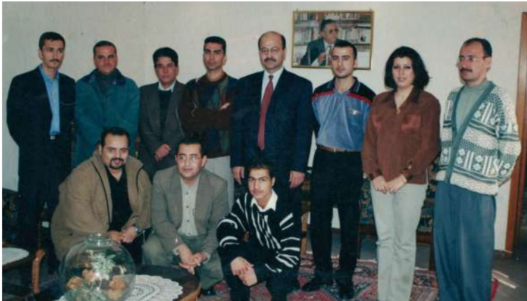
تیمی راگه‌یاندن و په‌یوه‌ندییه‌کان - حکومه‌تی هه‌رێم له‌گه‌ڵ د. به‌ره‌هم س‌ال‌ح سه‌رۆکی حکومه‌تی هه‌رێم