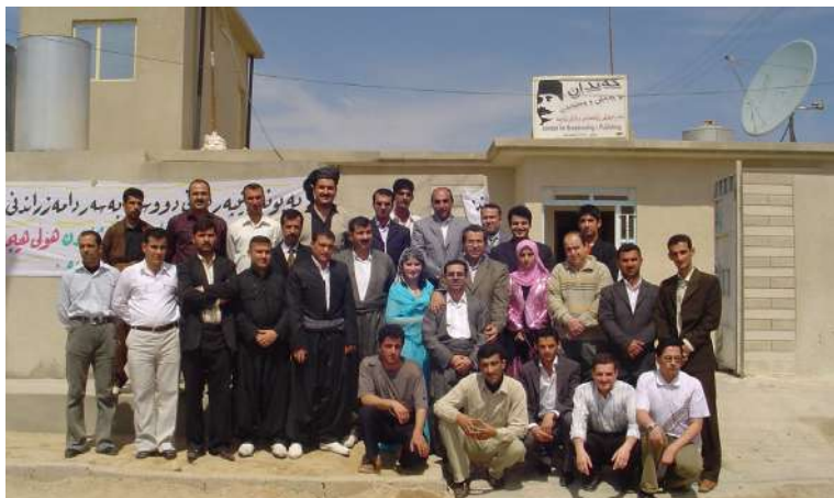
نووسینگهی خندان کهرکوک