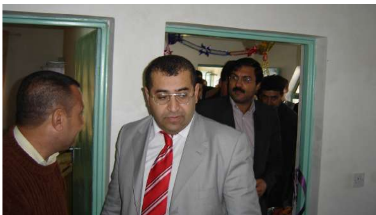
کردنهوهی نووسینگهی ناسۆ له گهرمیان