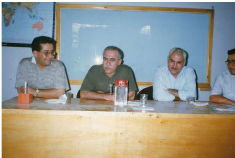
خولی ۲۰۰۰ بۆ بواری رۆژنامه نووسی سالی ۱۹۹۹ - سمینار محهمه د توفیق ره حیم