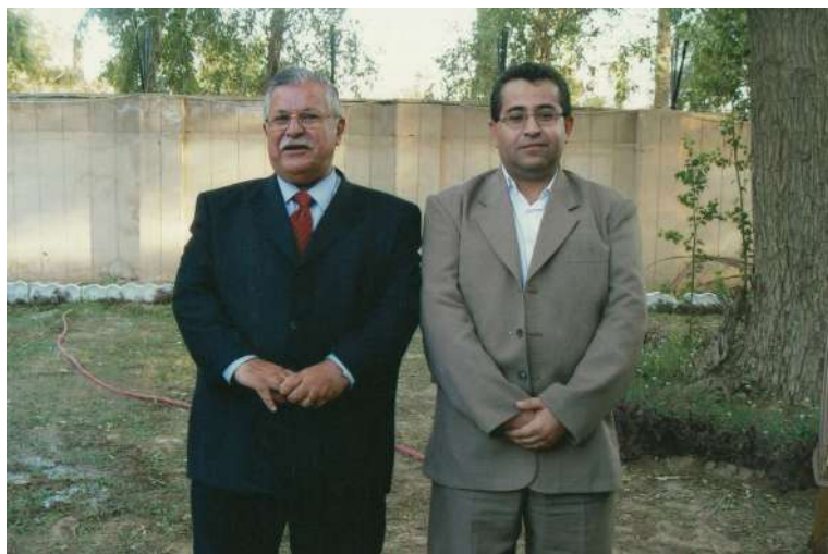
به‌غدا له‌گه‌ڵ سه‌ركۆماری كورد