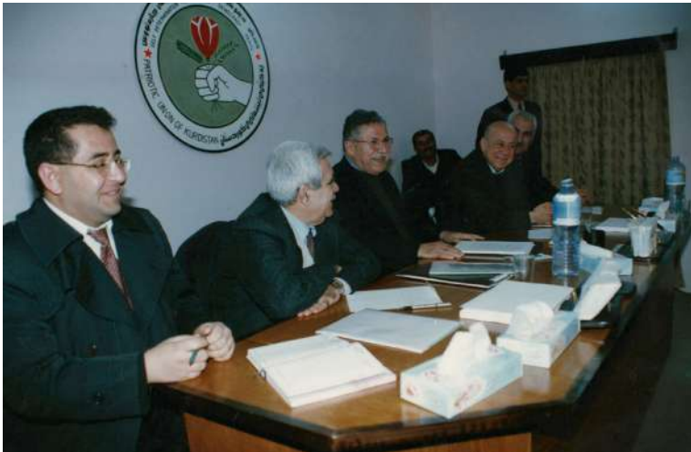
کۆبوونه وهی مام له گه‌ل ستافی کوردستانی نوئی سالی ۱۹۹۹