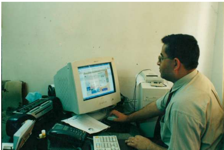
سلیمانی: سه‌رۆکابه‌تی ئه‌نجومه‌نی وه‌زیرانه - به‌شی راگه‌بان‌دن و په‌یوه‌ندیه‌ گه‌ستیه‌کان