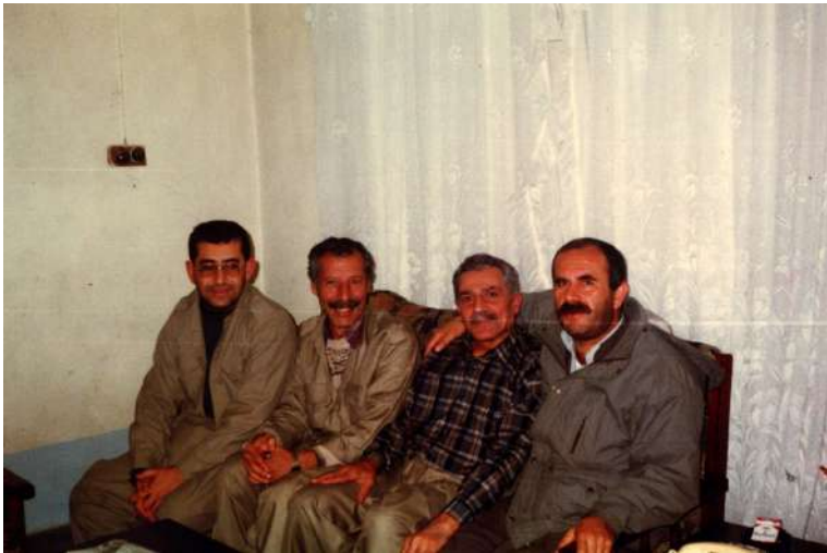
سالی ۱۹۹۷ نیردرواوانی راگه یاندن بو به رهی نه به ردی پیشمه رگه - له گه ل شه هید خه سره و شیره، کۆچکردوان عه باس به دری و محمه مد موکری