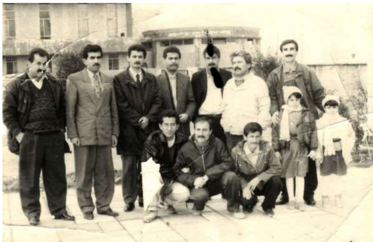
ههولپتر: سالی ۱۹۹۴ له گه‌ل به‌شیک له‌ستافی کوردستانی نوێ