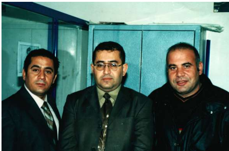
راگه یاندن و په یوه نډیه گشتیه کانی حکومت له م به شه هم کوردی به شه کانی تر و هه میښ عه ربه بی عراق به شدار بوون و ینه که: هوشه نگ دهر ویش (کوردی سوریا) و هادی مه هدی (به غدا)