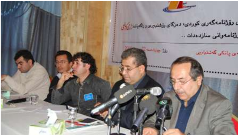
رواندز: كۆپى رۆژنامە نووسى بە بۇنەى يادى رۆژنامە نووسى كوردىيە وە