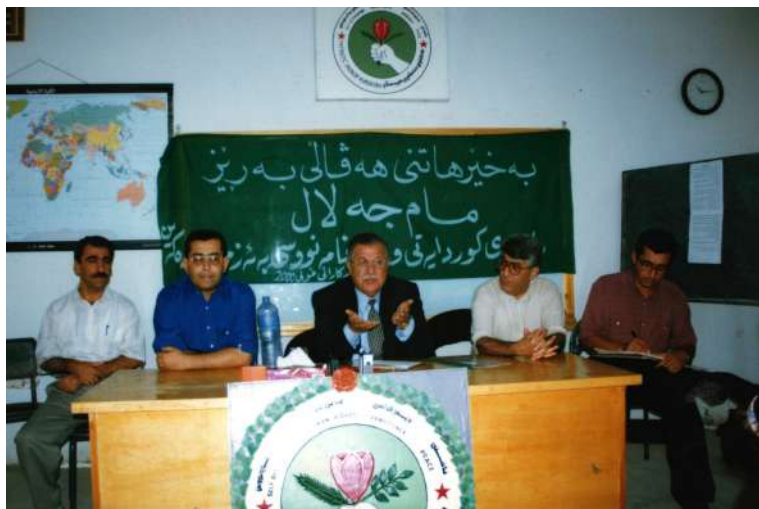
خولی دووهه زاری کوردستانی نوێ پۆ پیگه یاندنی روژنامه نووسان - سالی ۱۹۹۹