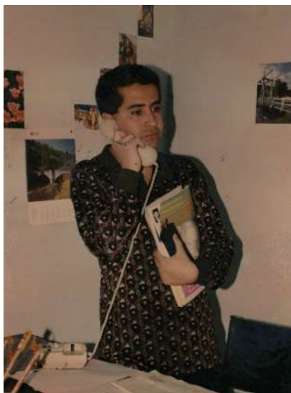
به پۆه بهری نووسینی کوردستانی نوێ له ساڵی ۱۹۹۷ به باوهشی گۆفاری تایمه وه