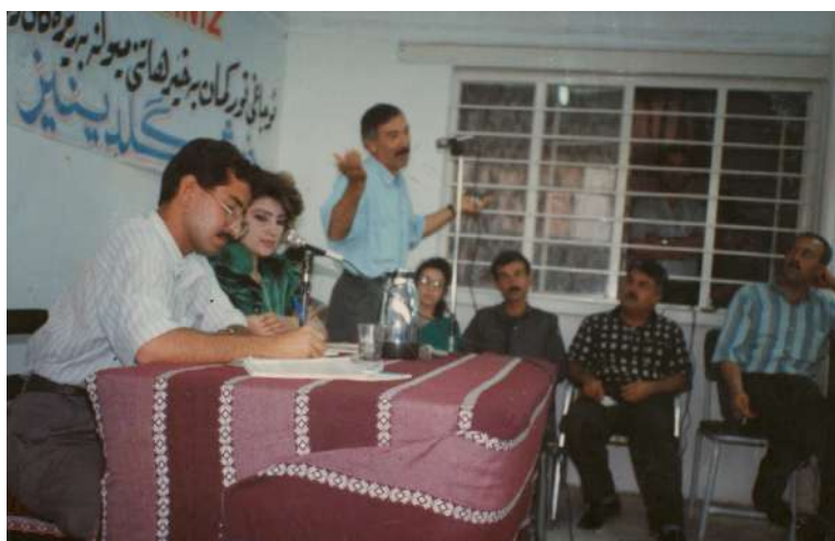
هه ولێتر: باره گای ئۆجاف تورکمان کۆری نووسه ره له سه ره کیشه ی تورکمان له کوردستان