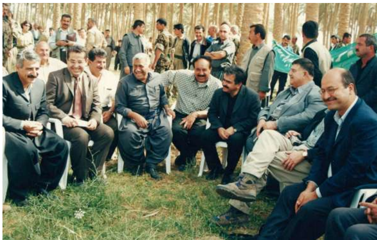
نیسانی ۲۰۰۳ خانەقین دوای نازادکردنی له پرۆسه‌ی رزگاری عیراقددا