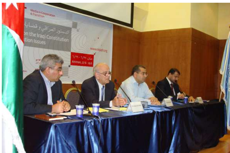
ئوردن: عه‌مان كۆرى ده‌ستوورى عىراق و مه‌سه‌له‌ى كه‌ركوك - سالى ١٩٩٧