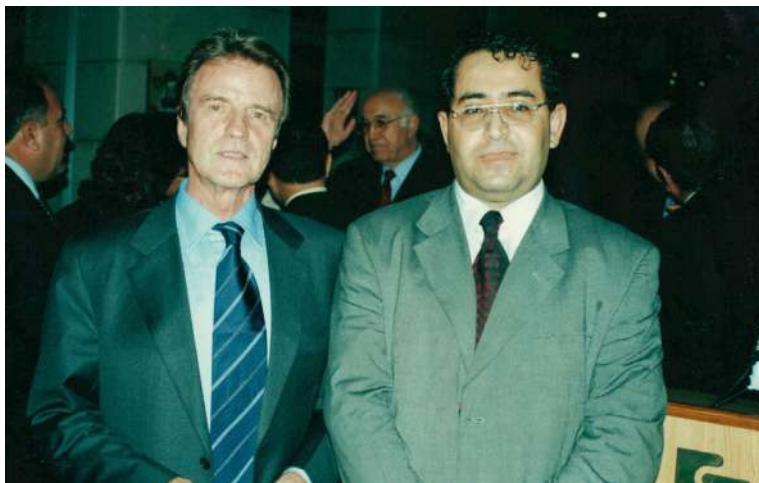
سالی ۲۰۰۳ له‌گه‌ل بېرنارد کوشنهر وه‌زیری دهره‌وه‌ی فره‌نسا