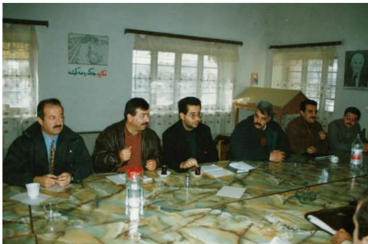
کتابخانه‌ی گشتی سلیمانی: ته‌گبیر بۆ دروستکردنی نه‌قابه‌ی رۆژنامه‌نووسان