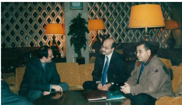
تاران سالی ۲۰۰۲ له‌گه‌ڵ دکتۆر به‌ره‌م سه‌رکی حکومه‌تی هه‌ریم (سلیمانی) و رۆژنامه‌نوس غسان جدو