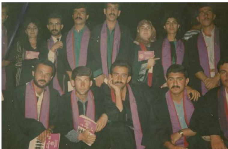
قوﻧﺎغي زانکو سالی ۱۹۹۳