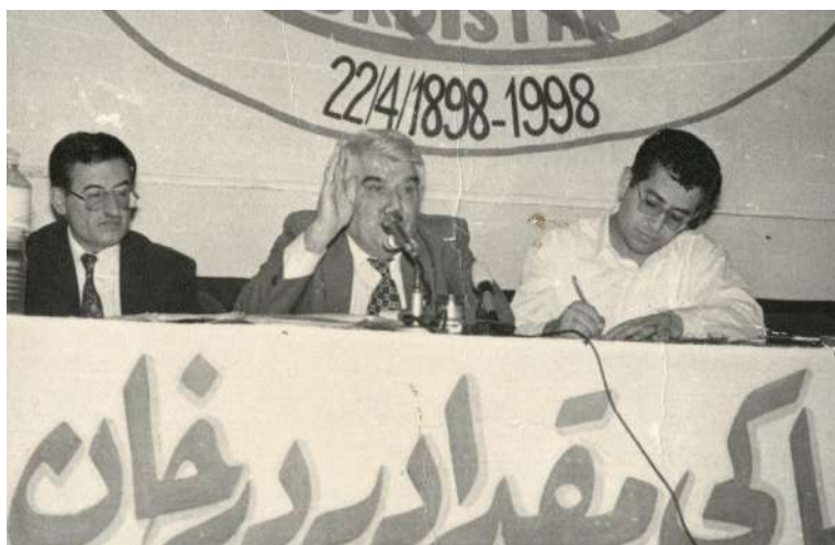
سالی ۱۹۹۸ - کۆپی پرۆفیسۆر د.عزه‌دین مسته‌فا ره‌سۆل له‌سه‌ر رۆژنامه‌گه‌ری کوردی