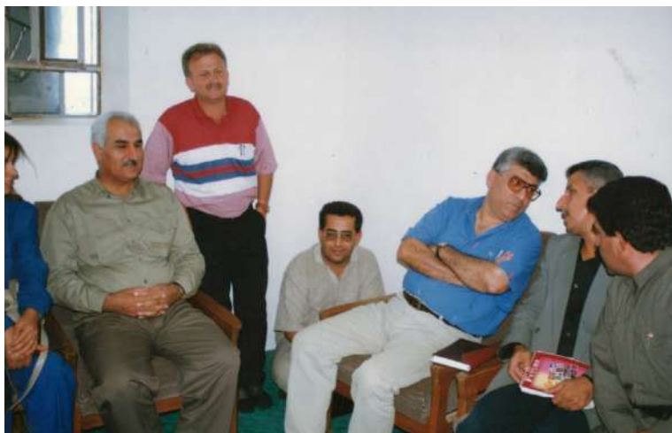
هه‌له‌بجه: کۆبوونه‌وه‌ی مه‌کته‌به‌ی راگه‌یاندن له‌گه‌ڵ راگه‌یاندن بزوئنه‌وه‌ی ئیسلامی