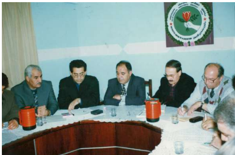
مه‌کنه‌بی راگه‌یاندن: کۆری سیاسی