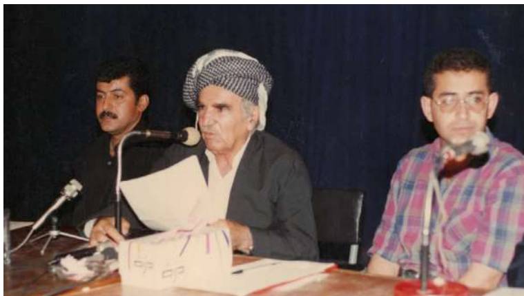
کۆنگره‌ی ۳۱ ی ئاب کۆری مامۆستا به‌هادین نوری سالی ۱۹۹۷