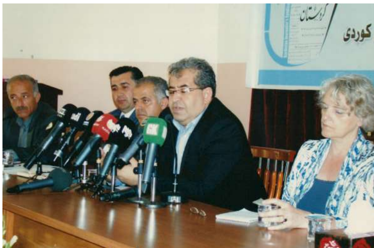
کۆر لهسه رۆژنامه گهري کوردی