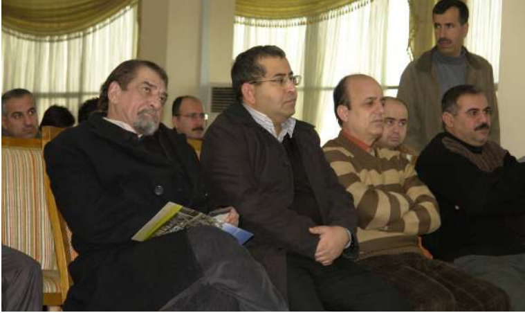
وۆرك شۆپى خەندان