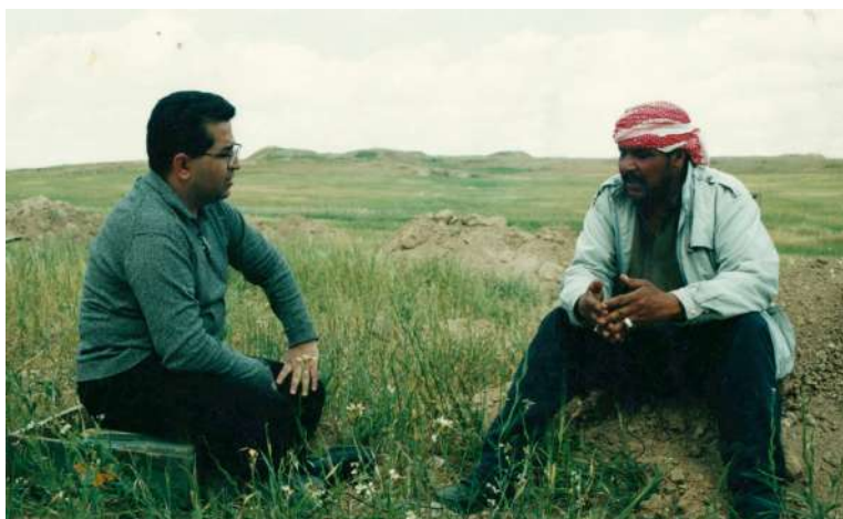
که‌رکوک: سالی ۲۰۰۳ وه‌ک نوینه‌ری حکومه‌تی هه‌رێم لێکۆڵینه‌وه له‌گه‌ڵ سایه‌قی شۆفاییکی ئه‌نفال ده‌که‌م