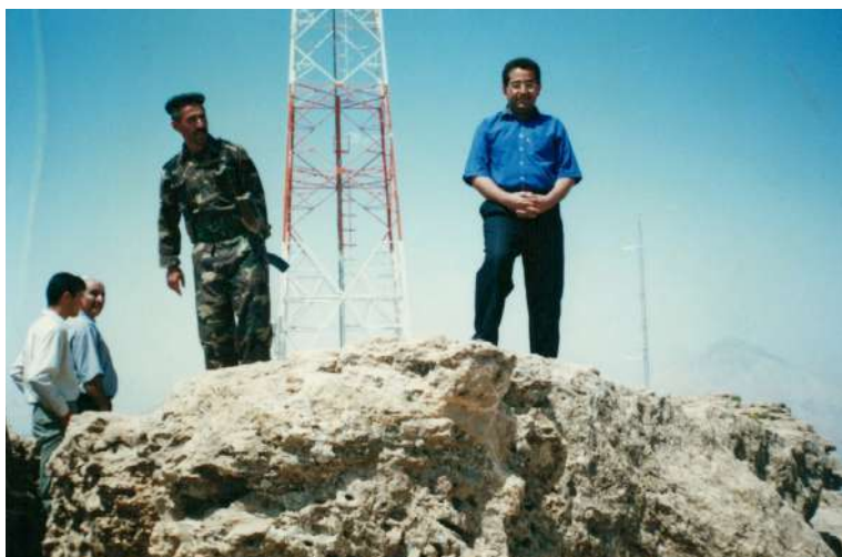
له سه ر شاخی سارا - شوینی بوجی ته له فزیونی گه لی کوردستان