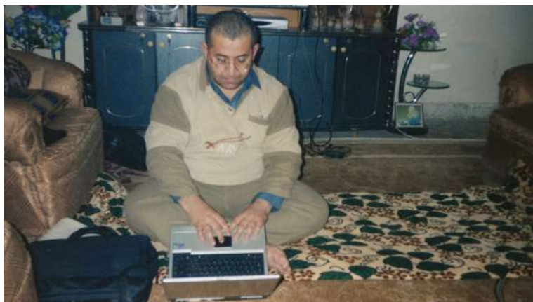
خەندان و روژنامه‌ی ئاسۆ - قۆناغی که‌رکوک