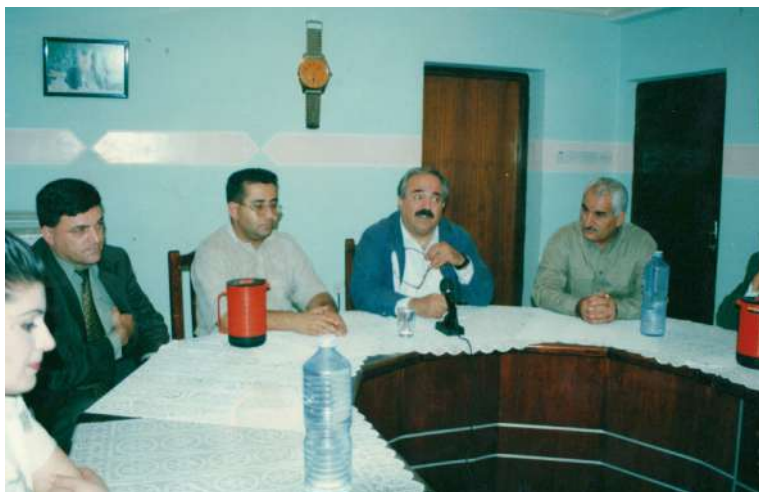
مەکتەبی راگەیاندن: کۆری شازاد صائب نوینەری یە کیتی له ئەنقەرە