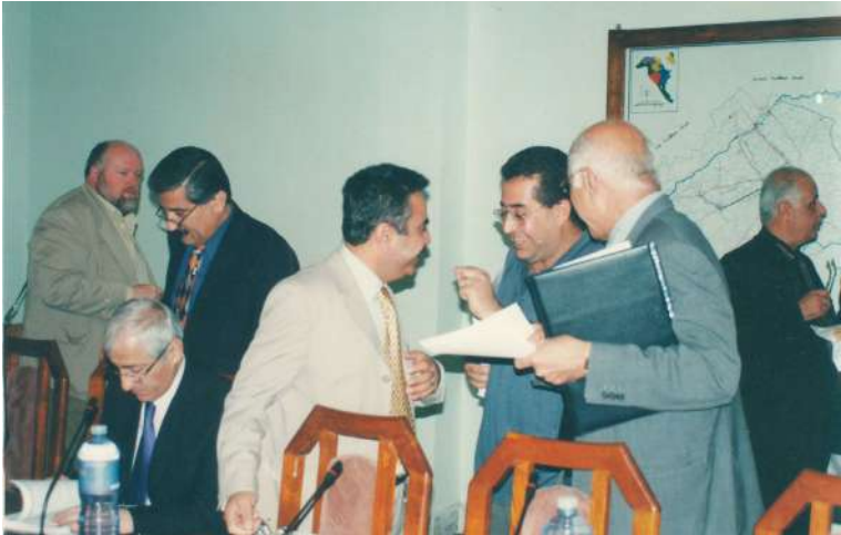
هۆلی کۆبونوه‌هی ئەنجومنه‌نی وه‌زیران