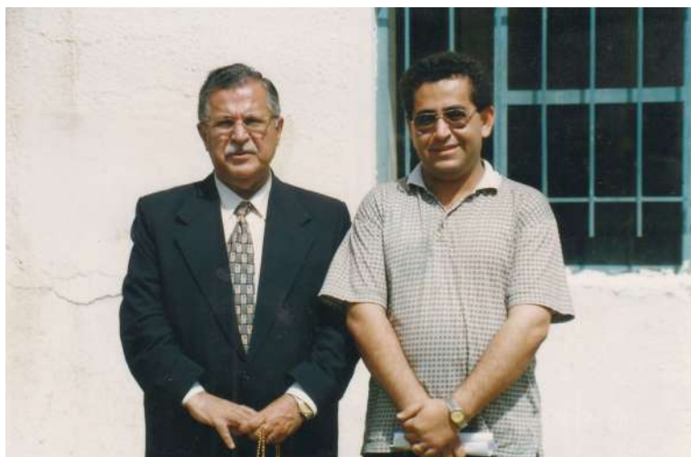
روژی دامه‌زاندنی ریکخراوی ئازادی لاوان