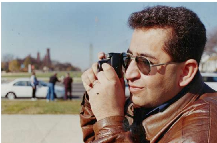
وہک فوٹوگرافریک له ئەمەریکا سالی ١٩٩٩ ویئەگرتنی هیندۆ سورەکان و خێوەتەکانیان لە واشنتۆن