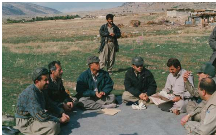
سالی ۱۹۹۷ نه به ردییه کانی گه رده لولی توژله له گه ل فەرمانده جه بار فەرمان و هاوړیکانی