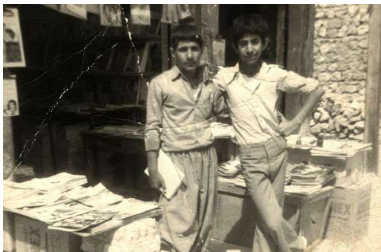
که رکوک: شۆریجه کتیبخانەهی موسەنا له شۆریجه