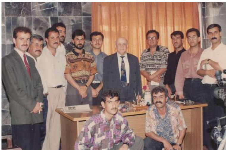
تیمی راگه یاندنی یه کیتی له گه ل د. که مال فوناد دوای کۆبوونه وهی ناشتی له مه سیف - سالی ۱۹۹۵