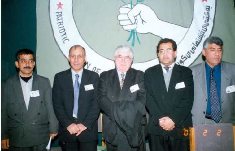
کۆنگره‌ی دووه‌می یه‌کیتی سالی ۲۰۰۱