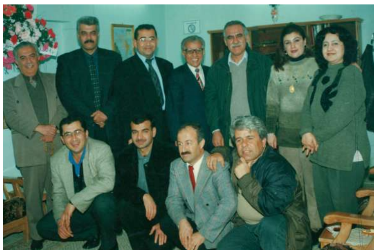
روژی مائتاوایی له کوردستانی نوێ کابینه‌ی یه‌که‌م - سالی ۲۰۰۱