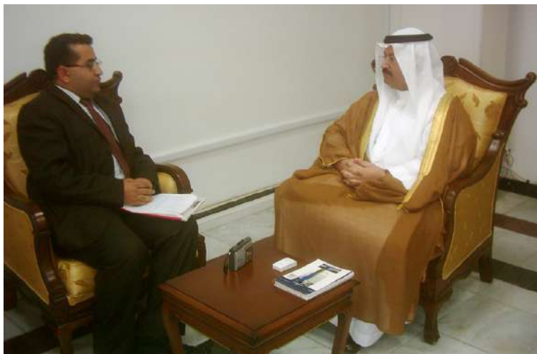
سليمانی: سه‌روكايه‌تی ته‌نجومه‌نی وه‌زیران به‌شی راگه‌یاندن و په‌یوه‌ندییه گشتییه‌کان