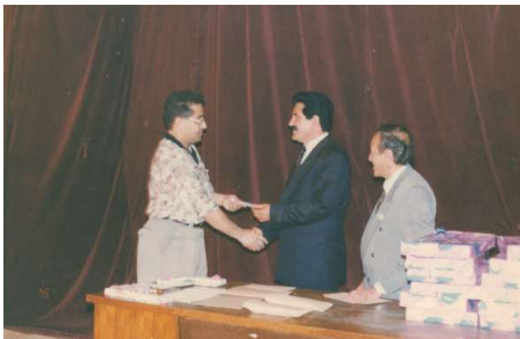
یادی روژنامه نووسی کوردی سالی ۱۹۹۸