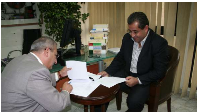
ئيمزاکردنی گريهه ست له گه ل کۆمپانيای ديزاين بۆ ديزاينی گۆفاری الاسبوعية