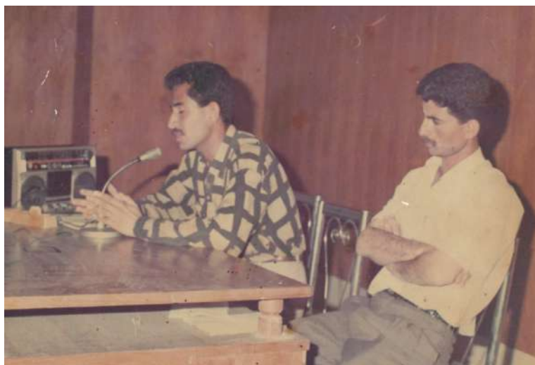
قۇناغى زانكۆ كۆرپىك لە سەر شىۋازى بەرھەمھېننى ئاسيائى سالى ۱۹۹۳