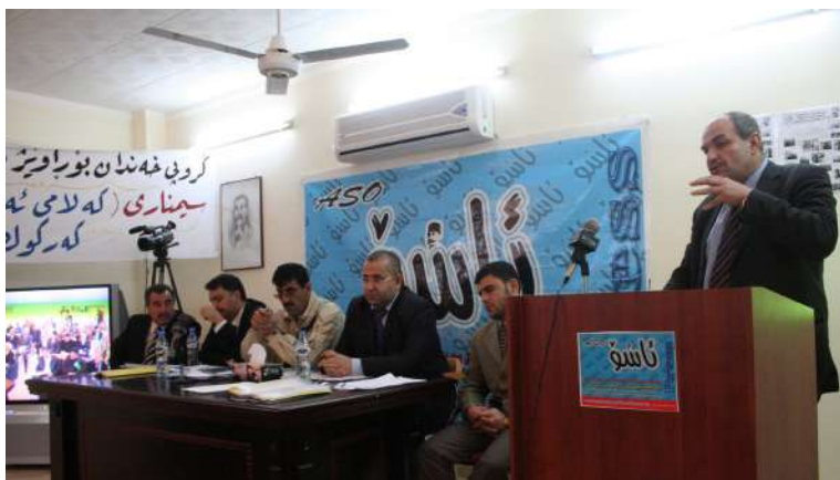
که رکوک: کۆری خهندان و ناسۆ