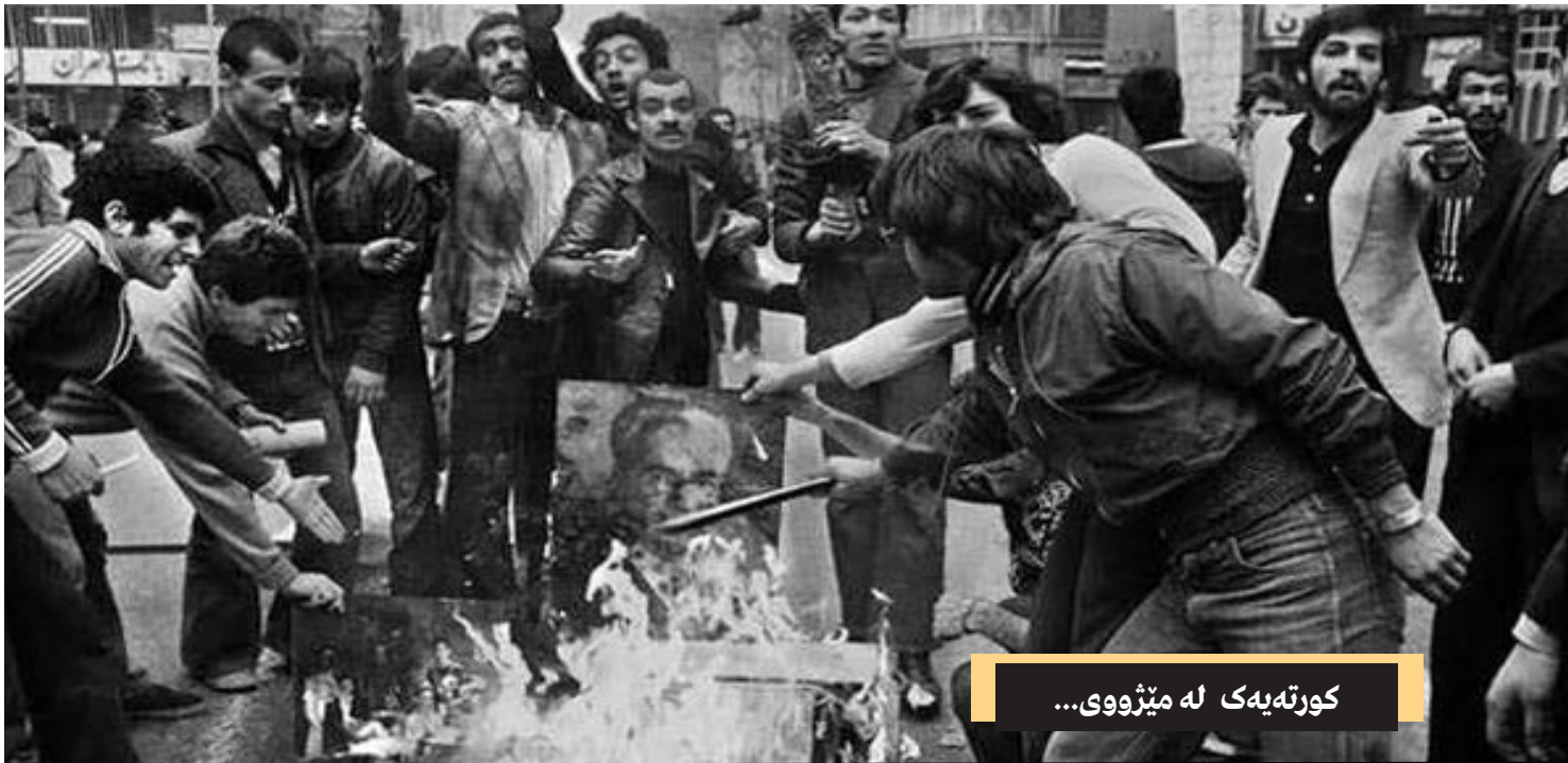
كورتەبەك لە مێژووى...

بە دامەزناندى كۆمارى كوردستان، گەشەى ئابوورى و فەرھەنگى پرووى لە ھەلكشان كرد. گوڤار و رۆژنامە و بلاوكراوہكان پەرەيان سەند و چاپخانە دامەزرا و ژنان ھاتنە ناو چالاكىە سىياسىيەكانەوہ و بىرارى خويندىنى زۆرەملى لەلايەن كۆمارەوہ دەرکراو لەو ماوہ كەمەدا، زمان و ئەدەبىياتى كوردى بووژانەوہىەكى يەكجار زۆرى بەخۇيەوہ بىنى.