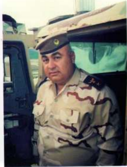
فہرماندہ شہید ہیوا قادر نہمین