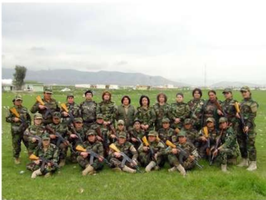
فهرمانده عقید ناهیدو پیشمه ارگه گانی له قاموجی ژنان