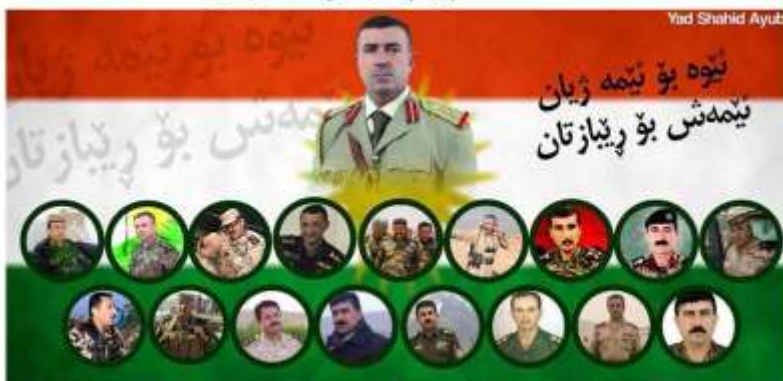
پۆلیک فەرمانده بو قازیمانی شههید