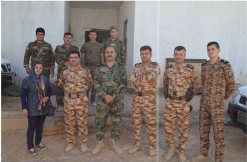
سائیکردگانی، بهشیر فرماده، محماد سانی لای، چاهم لهگابل، پنشمهرگهگانی