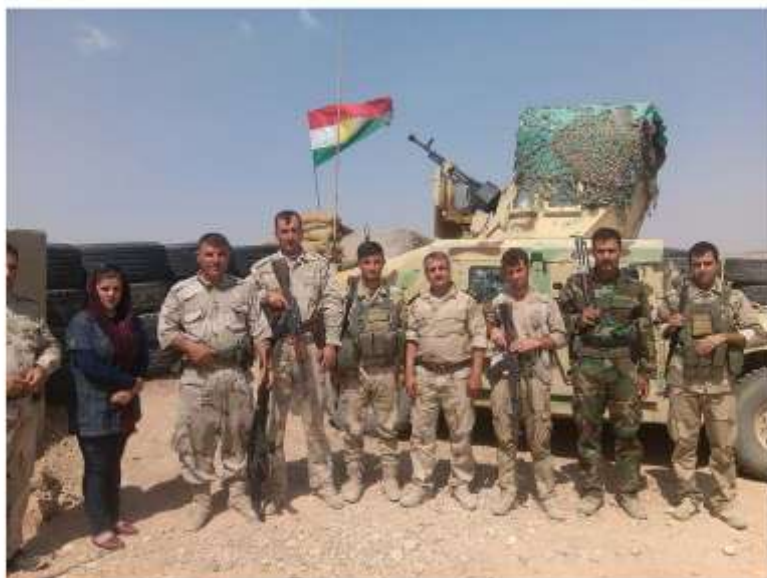
رهبانوسنگبر دکان له مرد