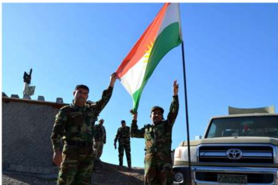
سائگر دکانی چامولا