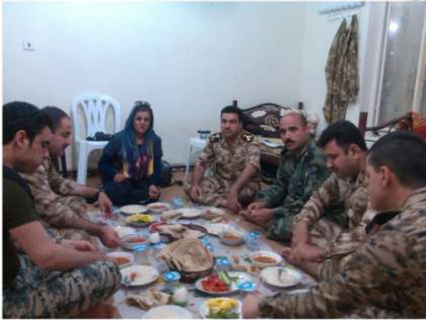
سەنگەردەگانی بەمشیر چەژنی قوربان.. 2015