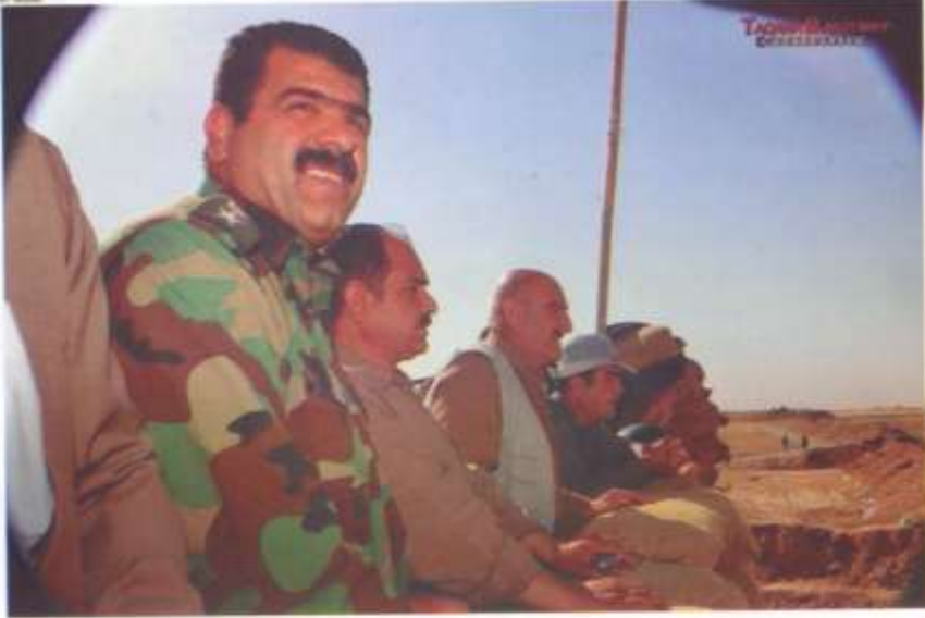
شہید فرماتده قارہمان چلیلی روستایی