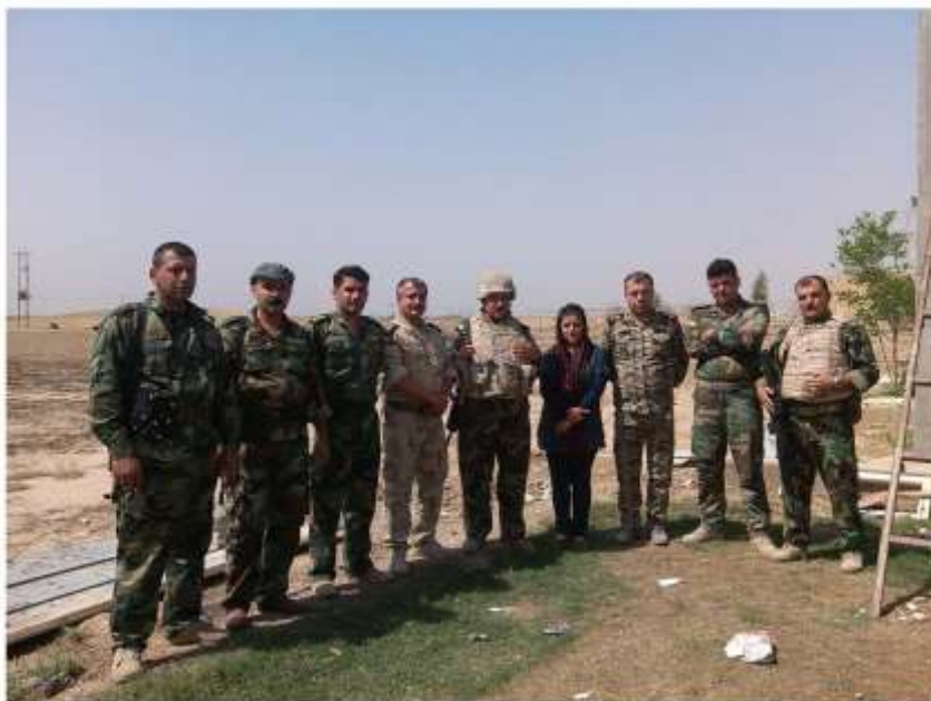
سنگبر دکتی مره