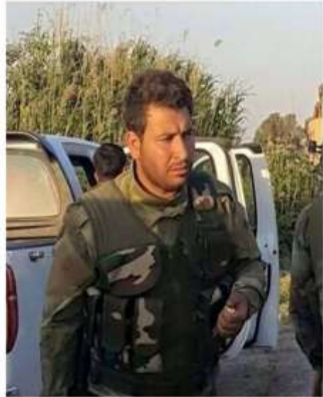
شهید ژیلوان کوری شهید شیروان کوری شهید لهحملا