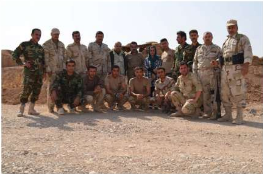
سەنگەر مەکشی مەویری مەلا عەنزی