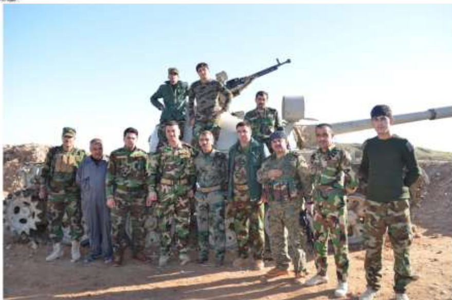
سائگر دکانی کویشی