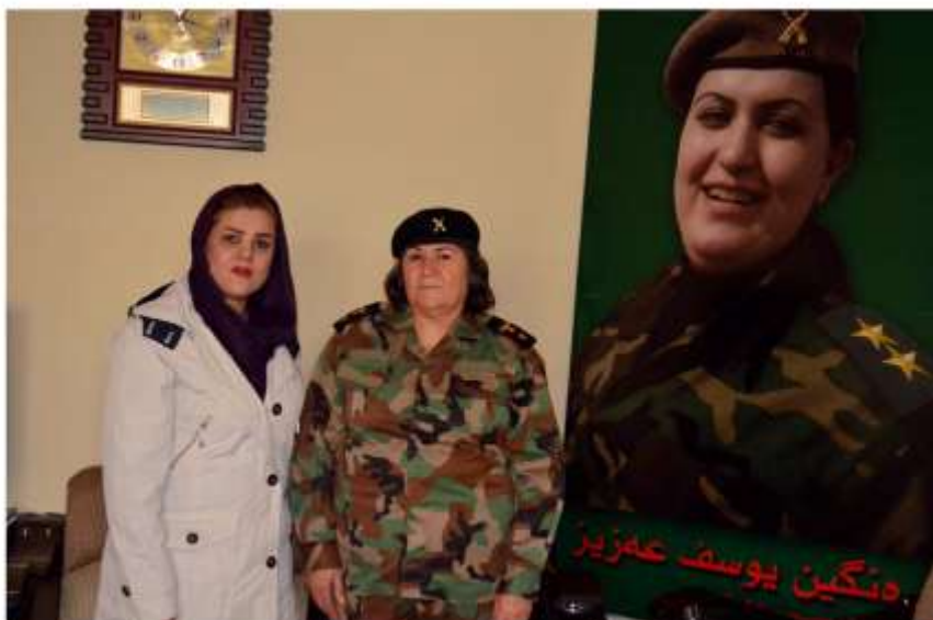
فهرمانده تاسرین جه لای دایکی شه هید رنگین