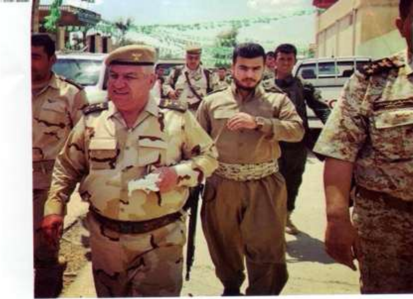
عمد فہسہل خہلہ کاتم