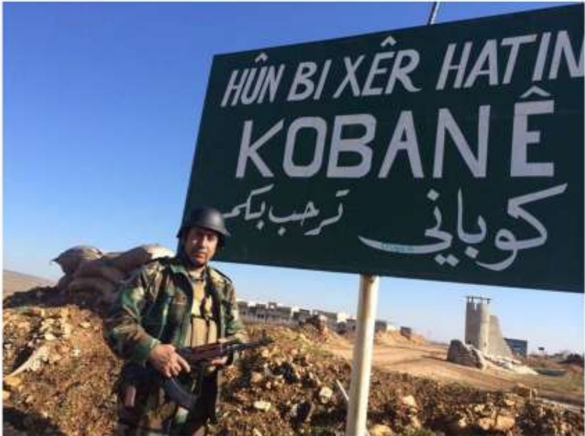
فهرمانده دحام گهر گهری