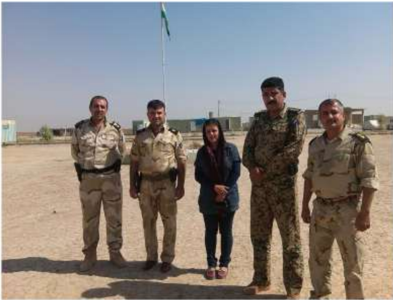
پيشمارگه کاشي سافاري حوز ديران