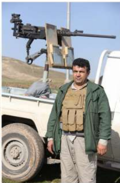
عقید شهید نهریمان مولود