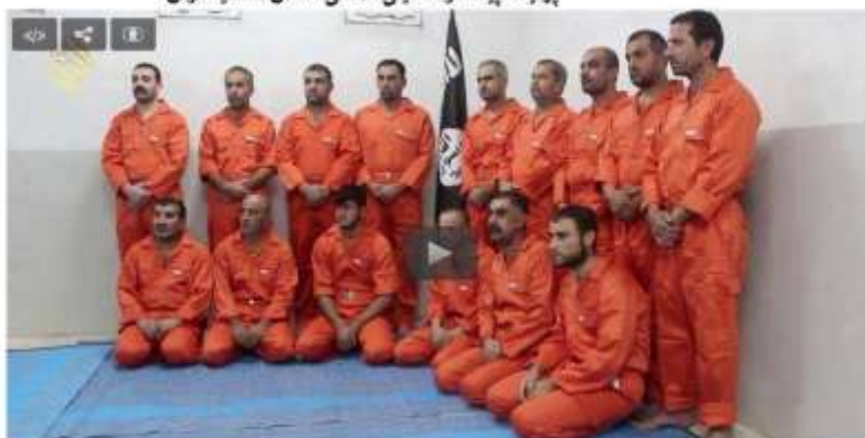
پۆلیک پێشمه‌رگه دیلی داعش شههید کران