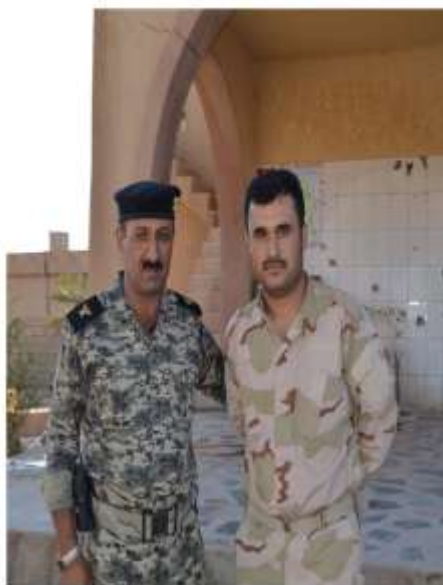
راند معني اېزن وېښماره گانې پېښور ناراس ته شوخ قېوب