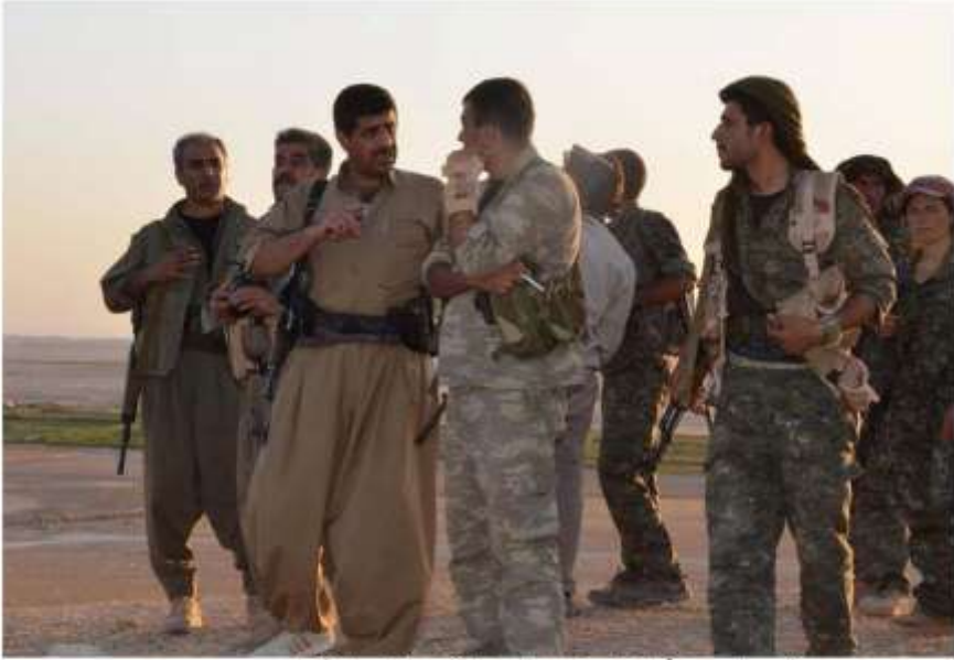
فەرماندە ھەلۇ پىنجوئىنى لە سەنگەردەگاتى شىنگال