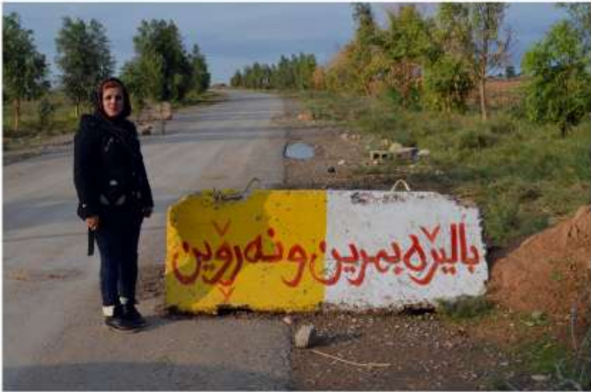
وتەبەشە جۆن لە ناوچەس داغوق لەسەر زیئەگی گۆتەدە وێر تەئەن