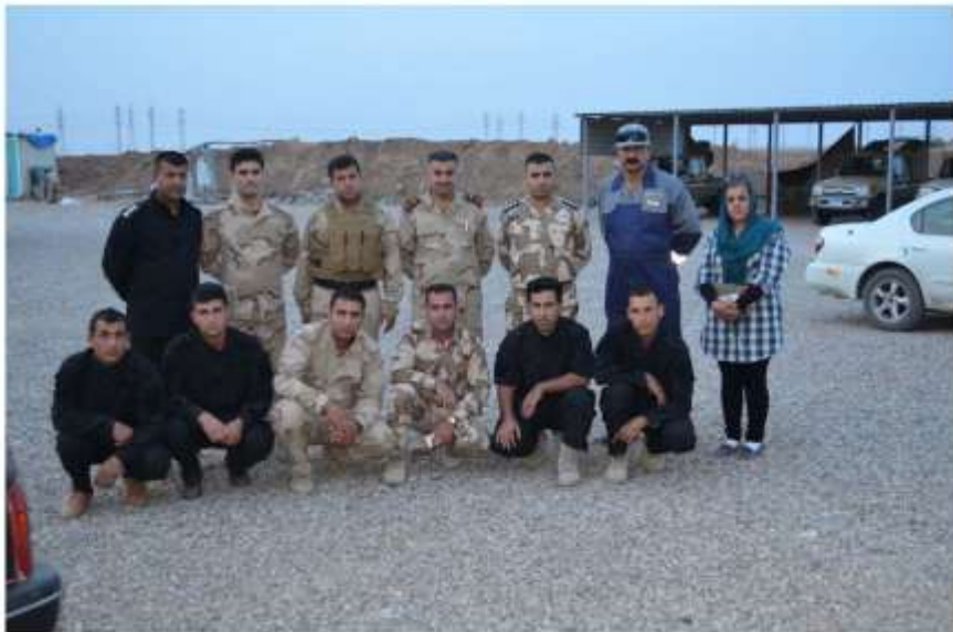
سەنگەر مەکشی تل لورد