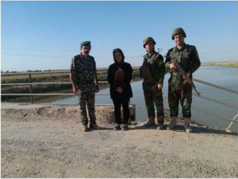
له سهر پردی ناوچهی مریم بیگ