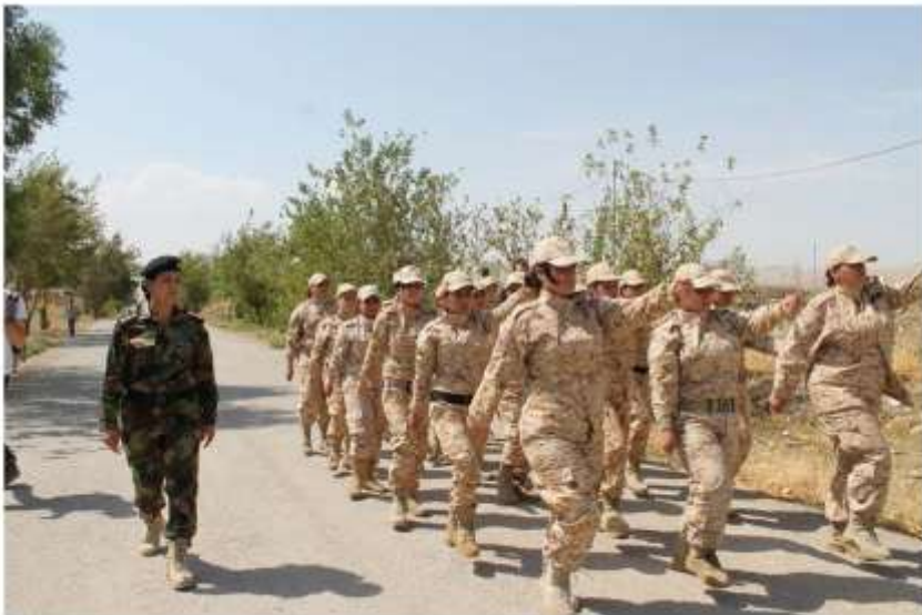
فرمانده شهيد رنگين وينشمارگهگاتي