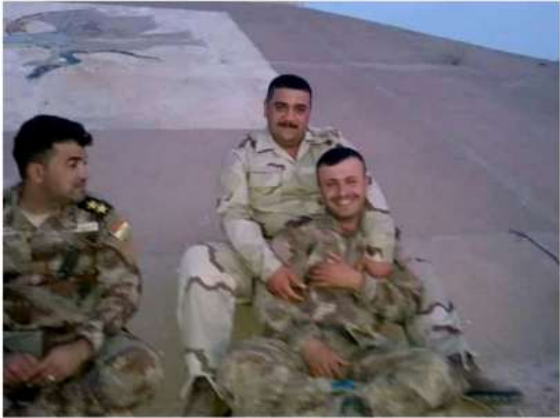
شهید گوران و هم‌تالانی