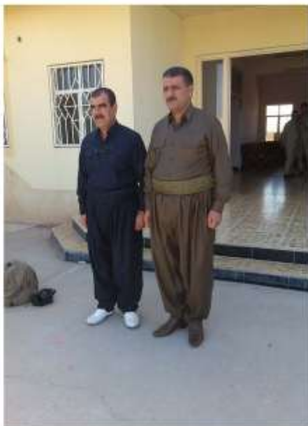
فرمانده لخوا هیوا عهولا