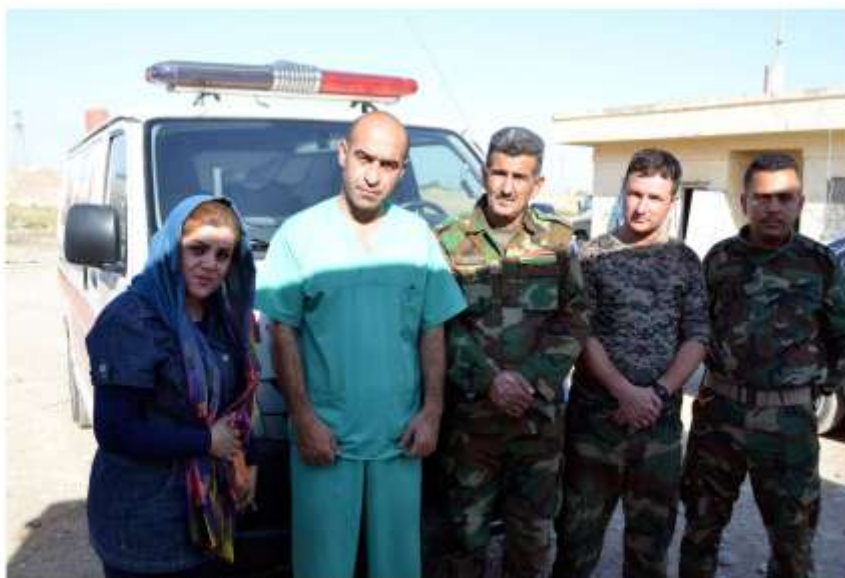
سانشگر دکتری به‌شیر کارمندی تامندوستی و فریا کاهوتن