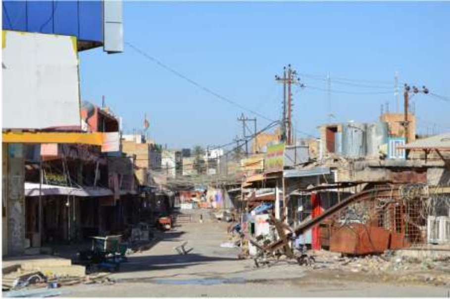
وزیرانہ مکتی چٹاھولا