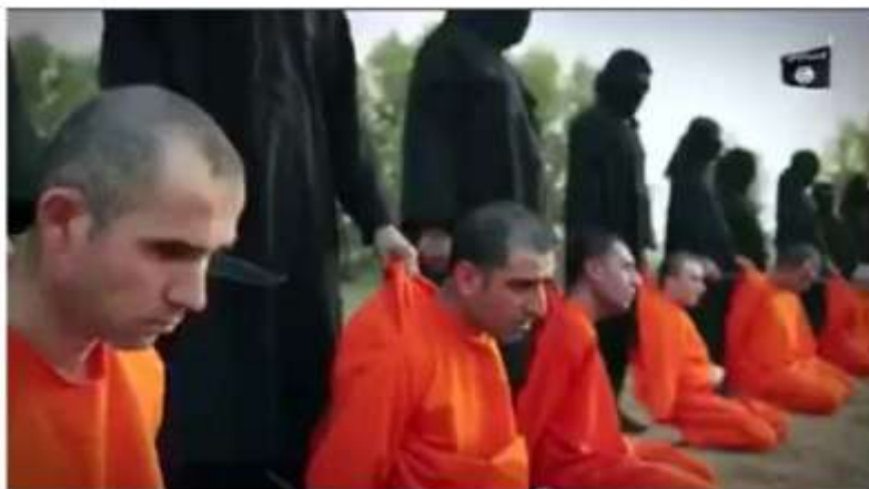
پۆلیک پێشمه‌رگه دیلی دۆستی داعش شههید کران