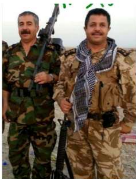
شهید فرمانده عمید سرپازو شهید فرمانده سلاح دیلمان