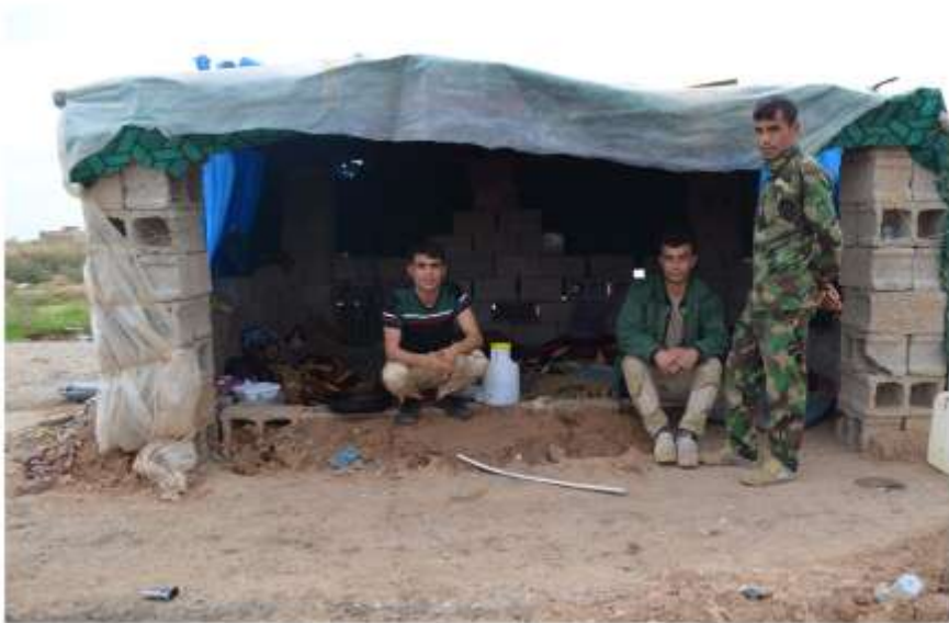
ژیانی پێشمەرگە کلایەکان لە دوو کیلومەتری داعش.