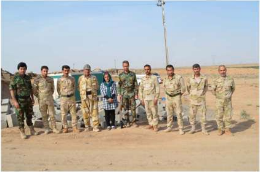
سازگار ملاتی معروفی مهلا عامبوللا