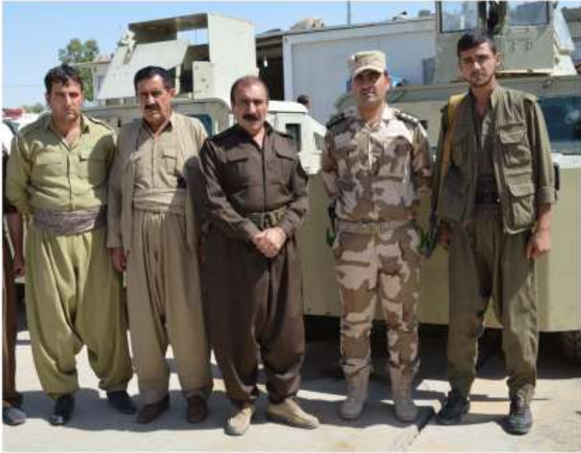
سازگرمگانی دوزخورماتوو فرمانده عبدالپوروو پینشمارگمگانی