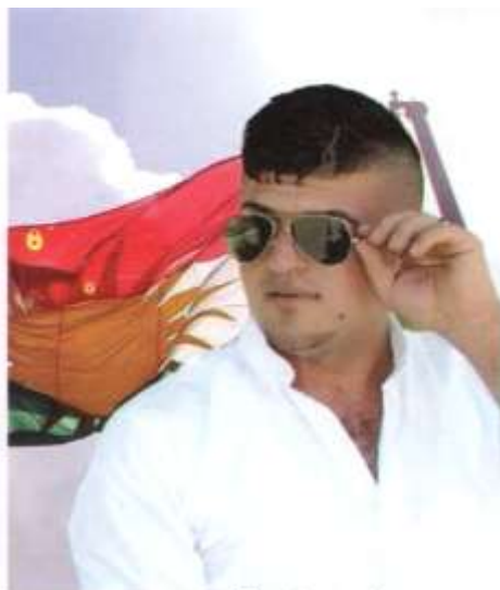
شهید محمد قهره وهیسی