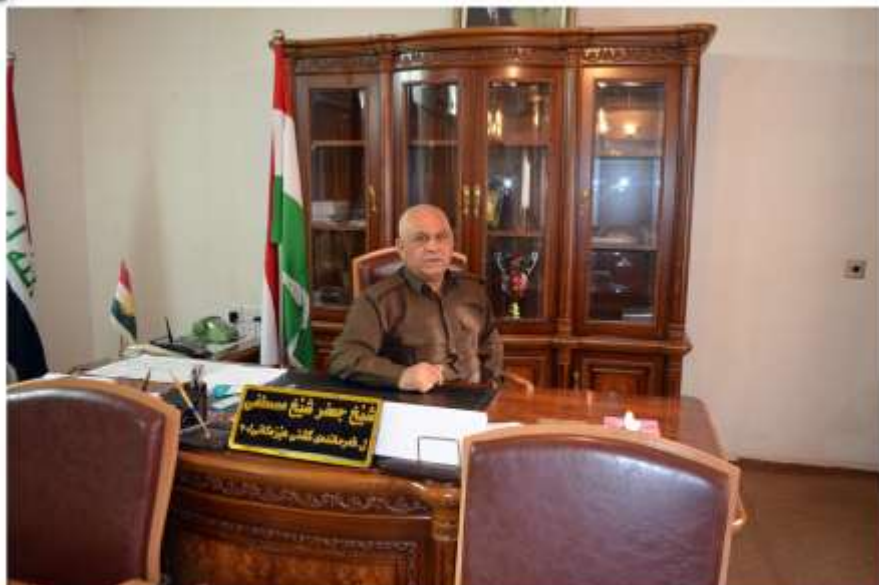
فهرماده شیخ جعفر شیخ مستعفا