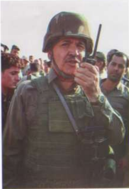
لہ سانگہرہکاتی کمرکوک فرماتده وستا رسولی