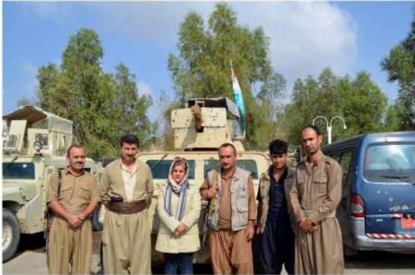
نگری محوری قادری