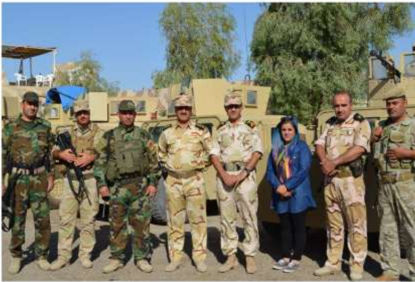
ماتاری خورماتوو عبیدرکن پینوارمحماد امین وپینشمارگمگانی