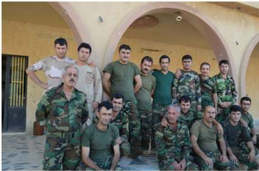
سەنگەردەگانی شیخ فەهال بەشمارگەکان ئە کاتی پشوو