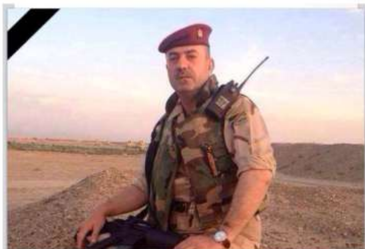
شهید فرمانده عقید رکن نامیوب محاسن