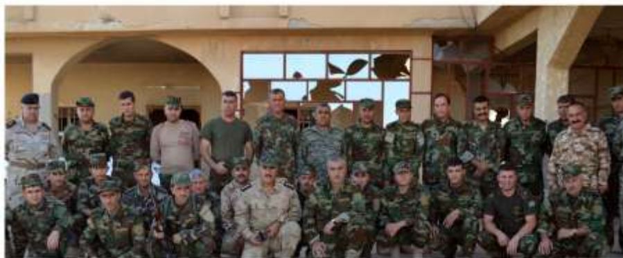
پژنیک پنشمه‌رگه له سانشگر دکتری شوخ فله‌ر