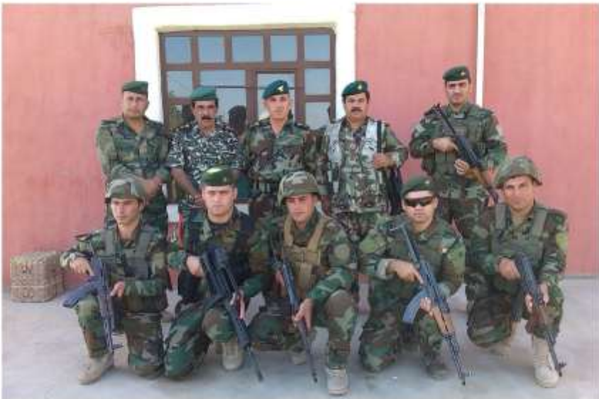
له سامنگه ره کانی مریم بیگ لئوا ته ها کانی بهردی و پینشمارگه کانی سکر تار بهت