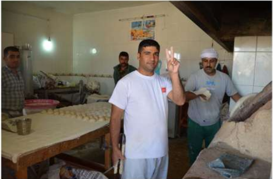
نڈاھو ایمنی خویہ مکتی نڈاھو چٹاھولا