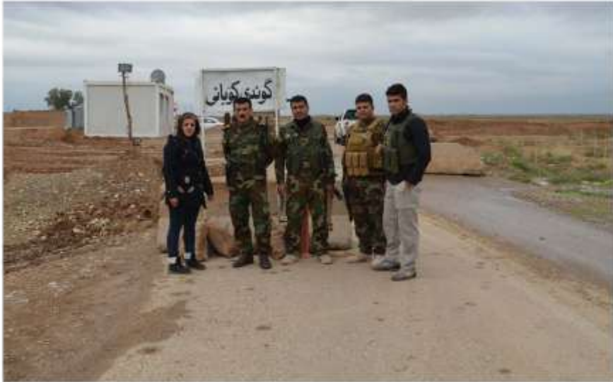
گوندی کوبانی ناوچه‌ی دافوق له‌بەر خۆ ڕاگری. ئەو گوندیەیان ناونا کوبانی.