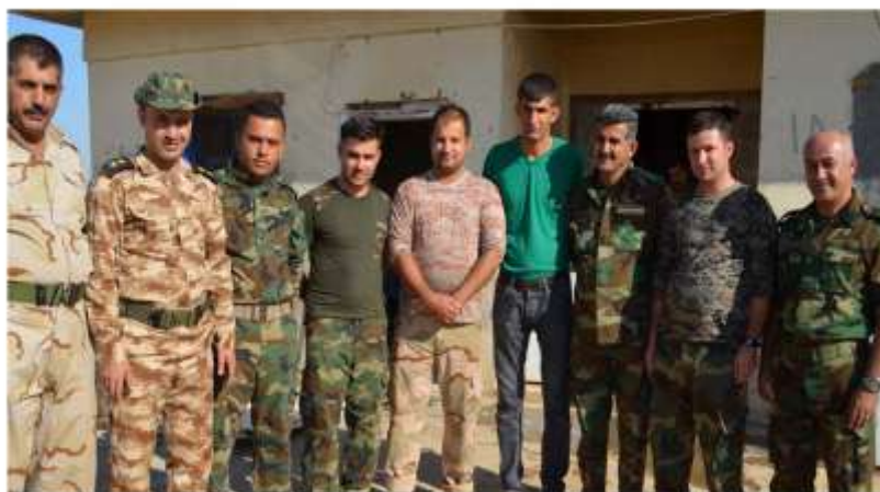
سامانگه دکاني پېښور پوښتک پېښماره رگه