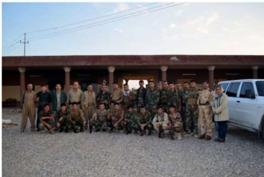
سنگار ہفتالی قلعہ تھاپہ