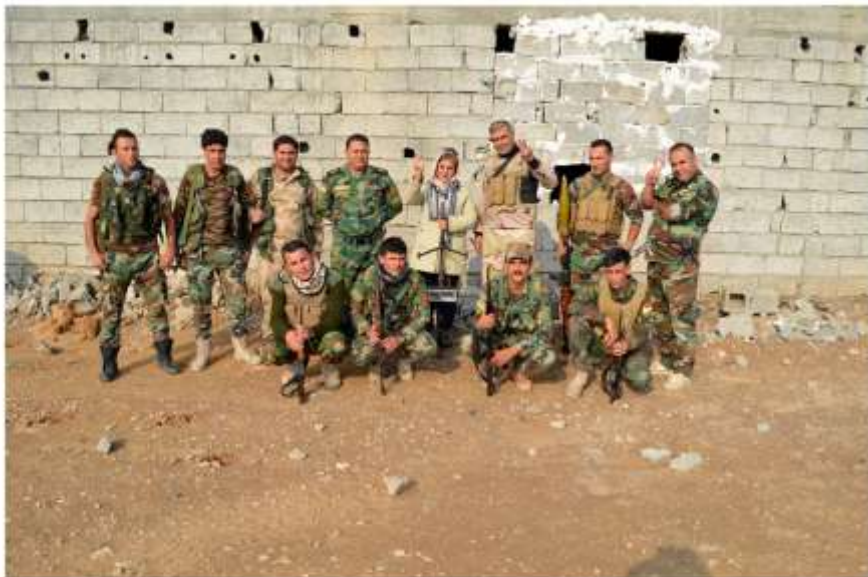
سنگار ہفتالی قلعہ تھاپہ