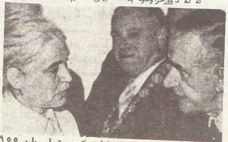
نانا سيگرس و توماس مان ۱۹۵۵

کوچی دوايي نانا سيگرس "من کتیب بؤ مزوق دهنووسم ، واته بؤ خطلکی ترو بؤ خوشم دهنووسم ، چونکه خوشم همر مزوقم . به بی بی شهوی باوه پشم بی بی همیه ، خهریکی کرنکترین کیشنه دهم که نیمزو خطلکی بایهخی بی دعات . همول دادم نهو کیشانه بؤ خومو بؤ خطلکی کیشتر چارهر بکم . بؤیه که شتیگ دلم خوتر دهکات یاخود نازارم دعات ، که لکل شتیگدا دهم ، یاخود دزی شتیگ دهم ، نهو کاته له نیکایهکی هونه ریهوه بهشداري چندان کسر دهکم . . . . ." نانا سيگرس ، چیرۆک نووسی گهری نلمانیا دیمو - کراتی که پاش تمه شیکي ۸۲ سالی له رۆزی چوار شهمی ۲۱ حوزمیرانی مانگی رابرد وودا کوچی دوايي کرد . بوو بهیکه له و نافرته مزانتهی که کله بوو زیکي بضرخی له رومان و چیرۆک بؤ مروقایمسی له پاش خۆمهوه بهجی هیشته . نانا سيگرس (که ناوه راسته هینهکی نیتی رایلیگه) له سالی ۱۹۰۰ دا له شاری مانیزی نلمانیا فیدرالی نیستادا له دایک بووه ، له سالی ۱۹۲۸ دا چۆته ریزی پارتی کومونیستی نلمانیهوه ، له سالی ۱۹۳۳ دا که هتلمر هاتوته سهر جوکوم ناچار بووه له کل خیزانه کېدا له وولاتهکی دهریدهری تاکو سالی ۱۹۴۷ ، واته دهوانین بلین سیگرس له کومپلی برتولد برشت و هیلینا فایگلی ژنی و هانز نیسلهرو هانریش مان و نووسهران و هونه رهمندانی تهره که له سهردهمی رژیم نازیمتو بههوی چهوسانهوه ناچار دهم وولاتی خویان بهجی بهیلین و پرووه وولاتانی تهروپا و شمیرکا کوچ بکن . پاش شهوی نازیهگان کتیب و نووسینه گانیا له نا و دهم و . . . . . دهسووتین . سيگرس یه کیک دمی له و نووسهرانهی که له دوورخراوه به ئه دبئیکی ملتزم بهشداري