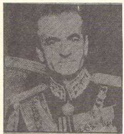
شاي شىران : پاش من شىر دەبىتە شىرانستان .

شىران و عوسمانى لە ماوہي چوارسەد ئال دا ، لىہ دەرەبەگان بە چەشنىكى زۆر فىلاوى كەلكيان ھەرگرتوہ : بەدەرەبەگان خەلات دەگرن دۇ چەند ناوچەي كوردستانىيان