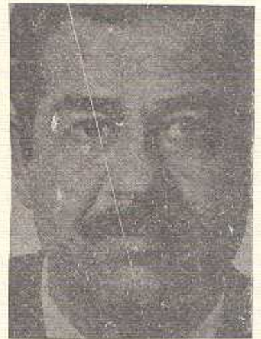
بەيمانى بەغدا زىندە و كوردنە ھە

بەداخە ھە ئەم نووسىنەم كورت و سەرىتە بى ھەكەم و كۆرى شاپە ، بەلەم ئەمە قەسە دللى بەشى زۆرى گەلى كوردستانە كەلابان وابە دەبى دەردەكەيان دىبارى كۆرئۆ بۆ ھەموو گەلانى ناوچەو جىھان پروون بىتە ھە . بەتابەت خوڠكو برا توركەكان فارسەكان و عارەبەكان . فرىبوى رەگەز بەرستان - دىخۆن . كوردستان رىكار كەن خۆشيان لەو تەنگ و چەلمەمە ركار كەن !