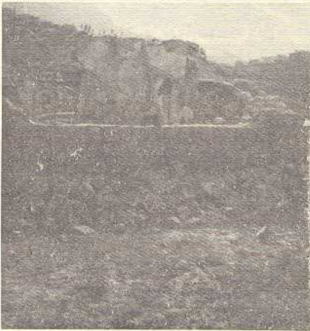
ھەموو ھەولدانىك بۆ وپران كوردنى كوردستان

بەلەم لەساڠى ۱۹۱۹ دا كوردان دۆى بەرىتانىا راپەرىپ... بەرىتانىا لەئىكرىكى بەھىزى ناردە سەر كوردان. شەرىكىسى قورس و خوڠناوى پرووى دا . شىخ مەحمود دەستگىر كرا . ناردىان بۆ ھىندستان . ھۆى كارەساتى كوردستان باش شەرى بەكەمى جىھانى ئەم چەند رودا و بەرھەلستەن: دۆزبەتە ھۆى نەوت لە ناوچەدا ، راپەرىنى ئۇسالىستى لە پرووسىلەى شەزارى ( قەسەرى ) و بىك ھىتائى بەكىتى سۆقىت . شىتاش ھەر شەو ھىزانە بەكىتى سۆقىت بە مەترسەكى گەورەدەزانى لەناوچەكەدا . سۆبەش رىيان بۆ ھاتنە سەر كارى رزىمى مەلىتانرىستى رەگەز بەرستى بەرچا و تەنگ خۆش كورد . شەو ھىزانە لەباش پەرى بەكەمە ھە تاركو شىتا نايانە ھۆى دللى دىكنا تۆرەكانو . داتاشرا وەكان لەخۆيان بىكەن .