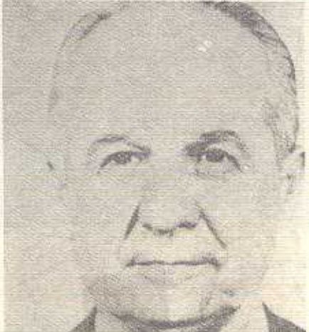
كەنعان ئىفیرىن - مىراتگرى سولتانە عوسمانىيەگان

بىرو راي كۆمەلایەتى بۆ كەل روون دەكاتەو ھەو دەبى دەزگای دەولەت بىكەوتىن ، خۆيان بە ئىكرابى بىبارئۆن . بۆ سەرگەوتن ئىكوشن ، خویان بناسن ، دەرووبەرىيان بناسن ، بزانى لىكۆئ دەژىن ، لە چ زەمانىك دا دەژىن ، دۆستى وان دەبى كۆئى . بۆ دۆستیان ئى ، تا چ رادەبەك بەدۆستا بەتتى باو ھە بگەن . تا چ رادەبەك لە سەر ھىزى دەولەت خىباب بگەن كۆ دۆژمنیانە بۆ دۆژمنیانە .