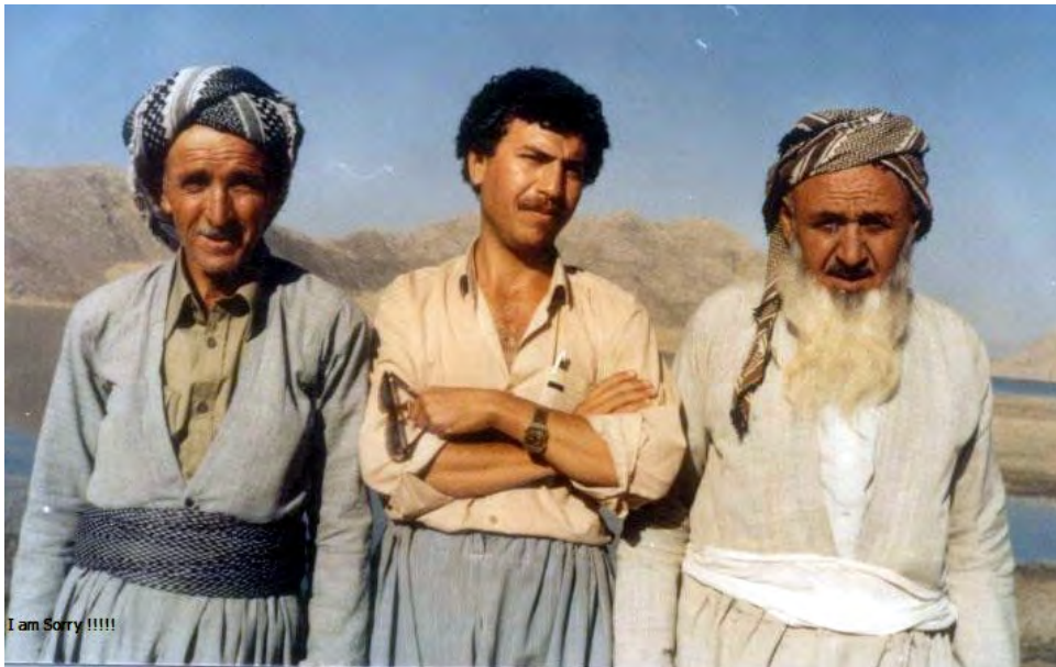
سۆفی عه‌لی چیانه‌یی - نزار کویستانی - فاتیحی