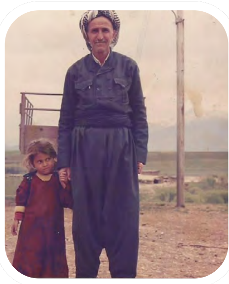
فاتیجی و تریفه‌ی کچی