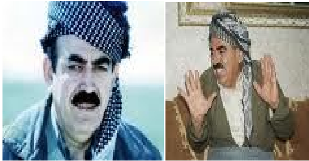
مهلا عوزیر مهلولد حمهد شیخانی، سهروک جاشی فهوجی 130