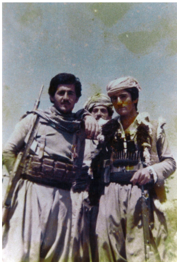
بارزان به هاری سالی (1984)، پشمره گه کانی حزبی شیوعی له چه پاره: 1. شهید عباس عه پو لئا خدر (سه ریز)، رابری سیاسی. 2. شهید جه عفر عالی خدر (زیوار). 3. بهرام نه کرم دوست پایی (دلزار).